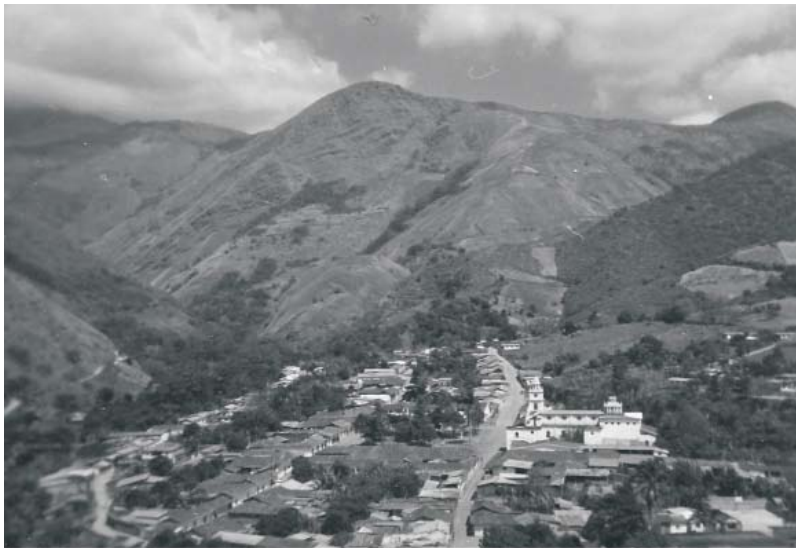
Mucuchachí, Cordillera Sur. Mérida.

observar una uniformidad en su historia oral. Esta homogeneidad, en relación con la visión del mundo y representación de la historia, es muy semejante a la que se puede notar entre los habitantes de la cuenca media del Chama y de toda la Cordillera Norte, e incluso, en algunas zonas de los Estados Táchira y Trujillo, (Villamizar y Bastidas, 1996) y al igual que en el resto de la Cordillera Andina venezolana, en la población de Mucuchachí existen aún lugares sagrados en los que se articulan elementos culturales indígenas y españoles, (Martes, 1998).