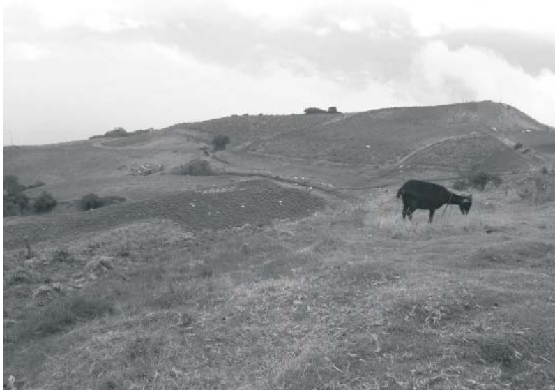
Tierras comunales del Pueblo indígena Timote. Mérida.

donde hubo una relativa concentración de población de origen africano, (Rodríguez, 1985: 26) mientras que para la misma época, el territorio de la zona del Páramo y de los Pueblos del Sur estaba, en su mayor parte ocupada por poblaciones indígenas.