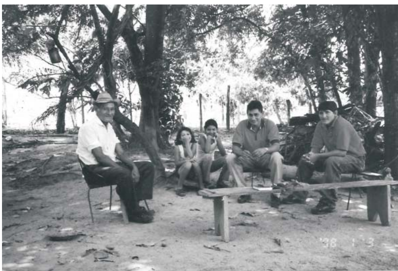
Pedraza, Barinas.

Volviendo a lo señalado por Fray Pedro Simón, podemos inferir que las incursiones de los Jirajaras no finalizaron en 1614, como él lo afirma, sino posteriormente, pues la tradición oral y escrita lo pone de manifiesto. Para 1616 vuelven a atacar Pedraza, dando muerte a un fraile agustino.