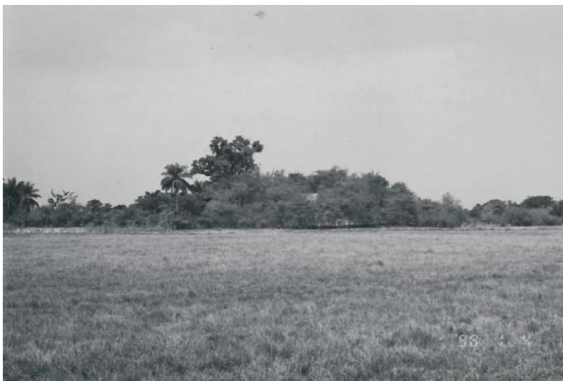
Curbatí, Barinas.

La aplicación del método etnográfico y la recolección de testimonios orales nos permitieron conocer la representación que hoy tienen los moradores de las zonas ya mencionadas de su mundo, de su