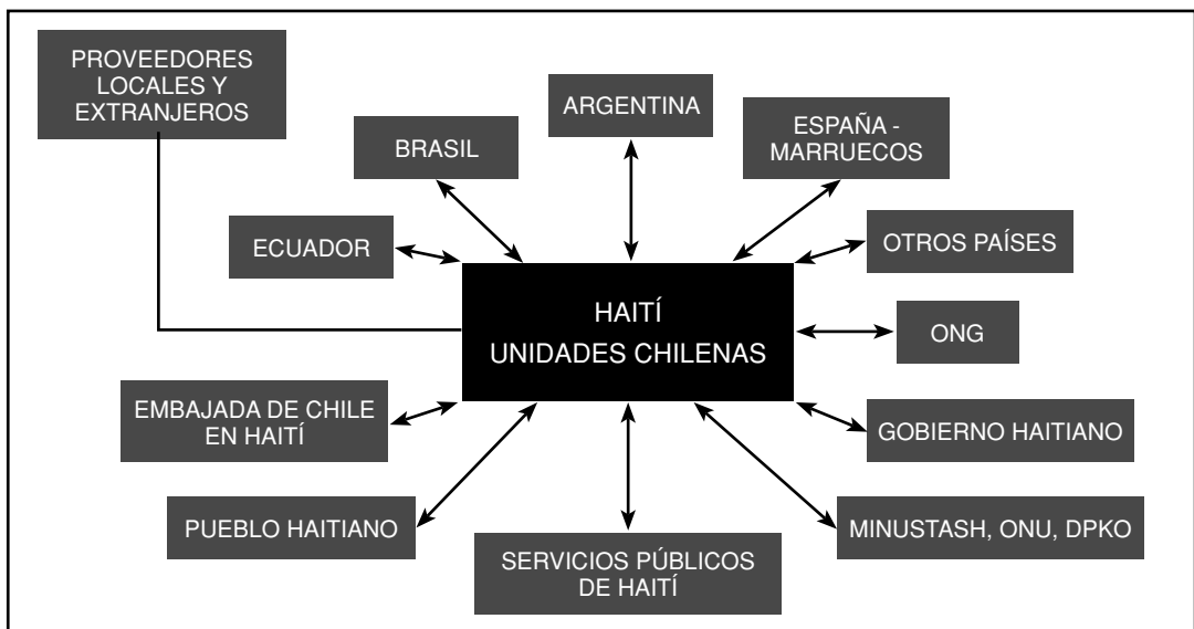
Diagrama de la interoperabilidad chilena en Haití. 40

De acuerdo con la naturaleza de los medios presentes en la actual misión en Haití, lo más importante ha sido el empleo simultáneo de unidades en forma conjunta y combinada. Ésta ha sido prácticamente una revolución desde el punto de vista de la contribución de la defensa a las operaciones de paz. Además, constituye el máximo nivel de "interoperatividad" en que Chile ha participado hasta el momento, en una operación de paz. 41