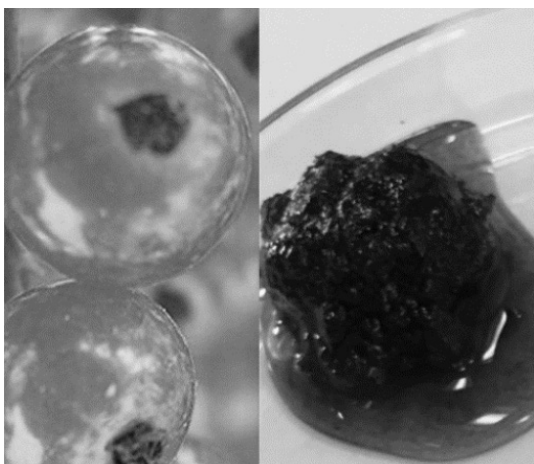
Figura 3. Dulce de grosella: textura líquida viscosa