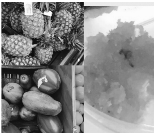
Figura 8. Dulce de papaya con piña: textura blanda gomosa