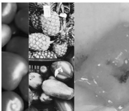
Figura 4. Dulce trifásico: textura líquida viscosa