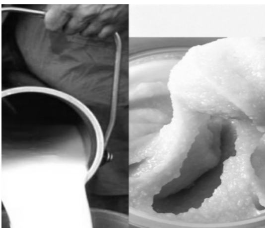
Figura 5. Dulce de leche: textura untuosa