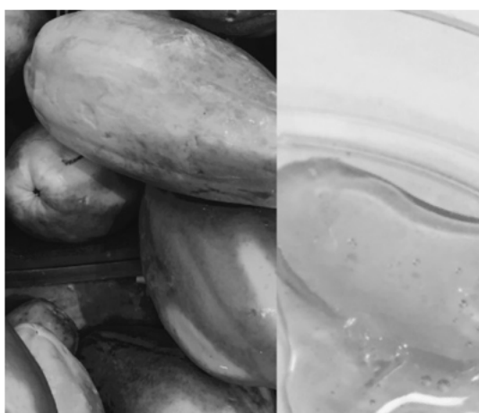
Figura 6. Dulce de papaya: textura líquida viscosa