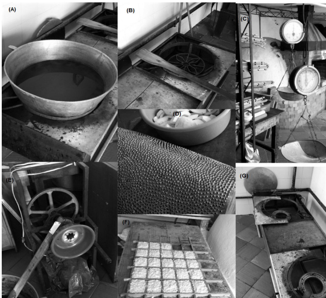
Figura 1. Utensilios y materiales para la elaboración de los dulces de Valledupar

Fogones a gas. estos constituyen la principal fuente del calor usada en la preparación de los dulces. La invención de los fogones a gas se remonta a mediados del siglo XIX (24), específicamente en Inglaterra, donde ganó gran popularidad porque se podía controlar con mayor facilidad la temperatura y, por lo tanto, las cocciones eran más sencillas. Fue hasta finales del XIX y principios del XX que empezó a internacionalizarse para llegar a ser parte de muchas de las cocinas (25) (Figura 1.G).