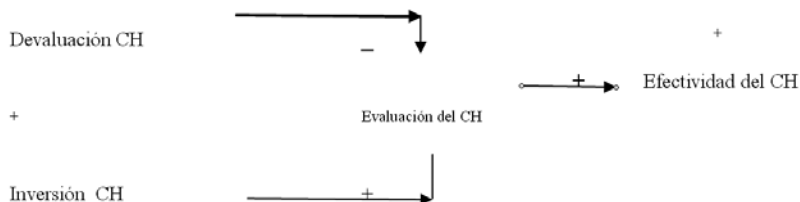
Diagrama No. 2