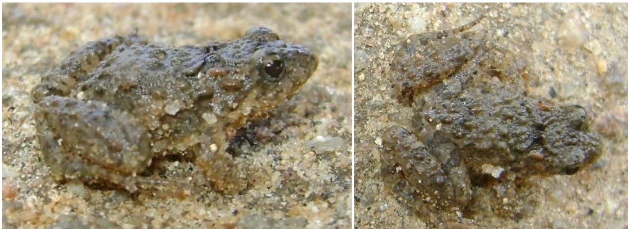
Figura 01: Indivíduo da espécie Pseudopaludicola falcipes (Hensel, 1867) registrado na Fazenda Tamanduá em ambientes de Caatinga na Fazenda Tamanduá, Santa Terezinha – PB, entre 16/04 a 18/04 de 2011.

O Coeficiente de Dispersão para os indivíduos de Pseudopaludicola falcipes (Figura 01) foi calculado para as duas áreas, apresentando os valores de 1,83 e 2,00 para os Ambientes A e B , respectivamente. Os valores indicam que os indivíduos da espécie estudada distribuem-se obedecendo ao padrão de Distribuição Agrupada , resultado confirmado através do teste Qui-quadrado que apresentou valores de X^2 iguais a 14,66 e 16,0.