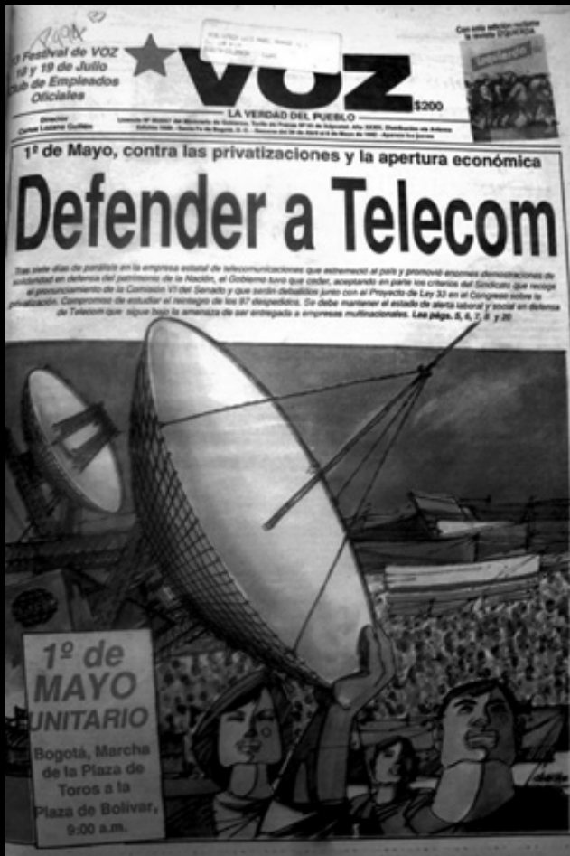
Portada de Voz. 30 de abril al 6 de mayo, 1992.