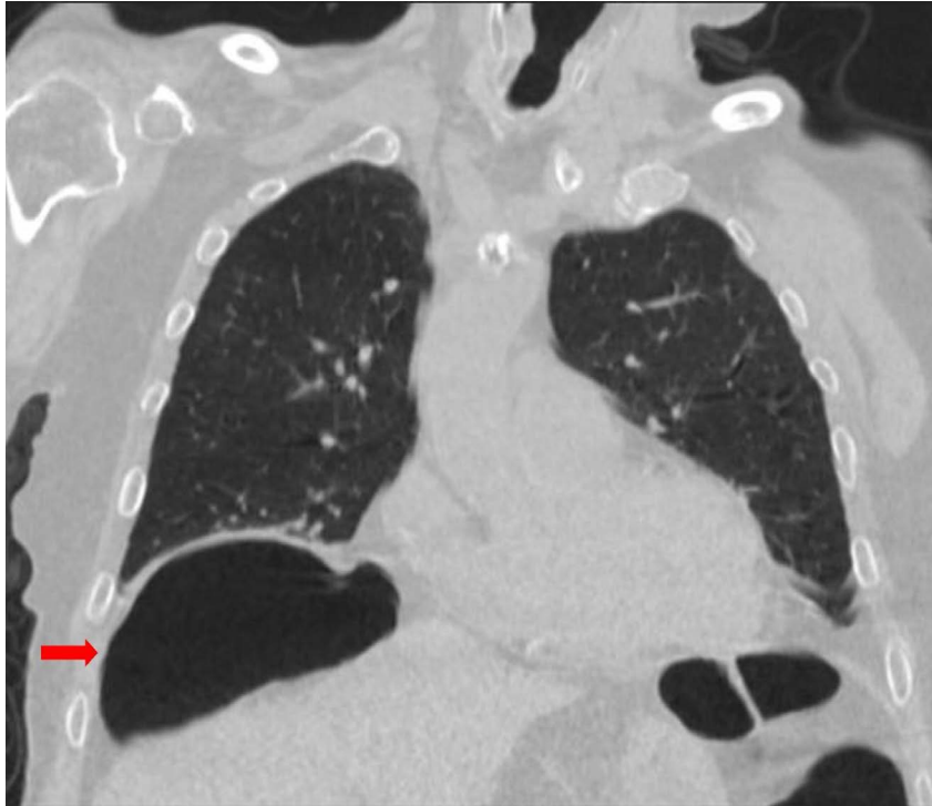
Figura 1. Tomografía Computarizada de tórax (corte coronal). Se observan ambos campos pulmonares y las cavidades cardíacas. La flecha roja señala el área hipodensa ovalada correspondiente al aire dentro de un asa de colon interpuesta entre el hemidiafragma derecho (línea hiperdensa arriba) y el borde superior del hígado (abajo), causando una depresión del borde superior del hígado.