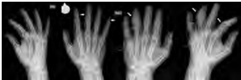
Figura 2. Manifestaciones radiológicas de la osteítis fibrosa quística. Las flechas señalan erosiones subperiósticas en una falange distal y en las porciones laterales de las falanges medias; además, un tumor pardo en dos de las falanges medias.

del tercio distal de la clavícula, lesiones de apariencia quísticas en los huesos, lesiones en «sal y pimienta» en el cráneo y tumores pardos, generalmente acompañados de dolor óseo [20].