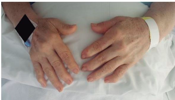
Figura 2: Es posible apreciar aumento del tamaño de falanges de los dedos así como de los huesos del metacarpo. Al igual que de la misma forma. Se aprecia desviación cubital de los dedos