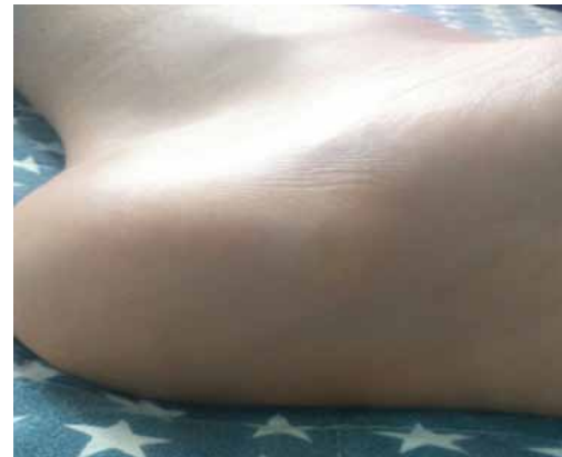
Figura 5. Lesión tras 1 mes de tratamiento con medicamentos homeopáticos (18/12/17).

El paciente no refirió ninguna reacción adversa al tratamiento homeopático recibido.