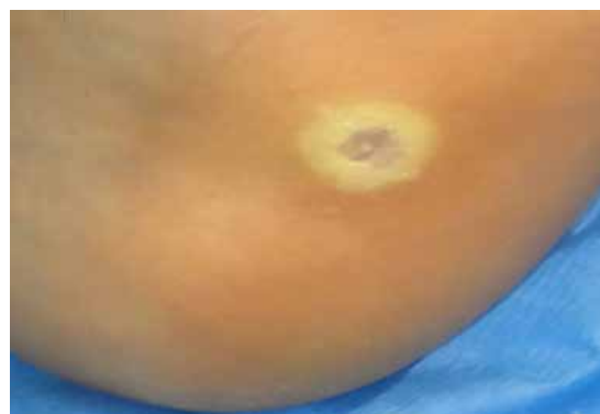
Figura 1: Lesión (talón izquierdo) en la primera visita a la farmacia. Fecha: 18/02/17.

Varón de 13 años que acude a la farmacia en febrero de 2017 con una lesión en la zona medial del talón del pie izquierdo (figura 1). Desde la oficina de farmacia se le deriva a un médico especialista en podología para diagnóstico y tratamiento.