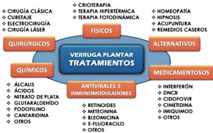
Figura 6. Síntesis y clasificación de los principales tratamientos descritos y utilizados en las verrugas plantares. Tomado de: Gabaldá Gallego A. Estudio comparativo del tratamiento de la verruga plantar por los podólogos del Área Metropolitana de Barcelona y los estudios publicados.

la Homeopatía con la evolución clínica favorable (figura 7). La existencia de antecedentes bibliográficos contribuye a confirmar esta impresión 12 .