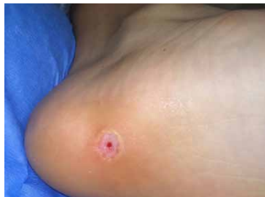
Figura 2. Lesión tras 2 meses de tratamiento con ácido nítrico, el 18/04/17.

La lesión fue diagnosticada por el especialista como papiloma plantar en la zona medial del talón izquierdo, con dos años de evolución. Se realizó tratamiento con ácido nítrico durante 2 meses, pero sin evolución favorable (figura 2).