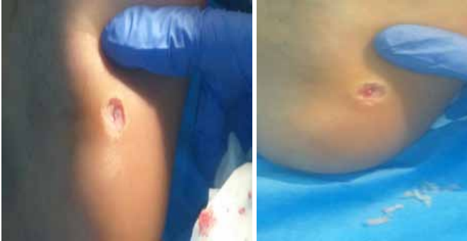
Figuras 3 y 4. Lesión tras 1 mes de descanso y tras 4 meses de tratamiento con cantaridina (18/09/17).

Tras 1 mes de descanso, se realizó un nuevo tratamiento con cantaridina durante 4 meses, sin que la evolución fuera satisfactoria (figuras 3 y 4); se le aconsejó al paciente que prescindiera de la práctica de la natación hasta la resolución de la patología para evitar nuevos contagios y/o aumentar la duración del tratamiento.