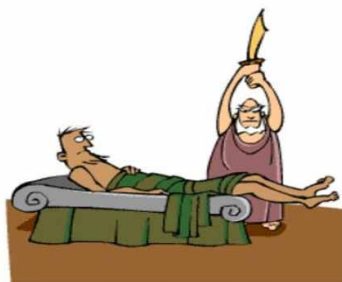
Figura 1. Procusto cortando la cabeza o los pies, para ajustar a los demás a sus deseos.

Aunado al tema de la pérdida de identidad, enfrentamos otro igual de grave. La ciencia reclama modernidad y no está del todo equivocada; pero la modernidad solicitada casi siempre significa alianza y convivencia placentera con lo convencional, con lo establecido 28 , y en el torbellino de información y conocimientos ofertados no sólo es realmente difícil, sino casi imposible mantenerse al margen de esta demanda sin perder la identidad, la razón de ser de la originalidad, de lo diferente, que es lo que ha sucedido con la Homeopatía en el ámbito educativo y en el de la investigación 29 , toda vez que a través de muchos esfuerzos hemos logrado que tenga un marco regulatorio y quede integrada formalmente a los sistemas educativo y de salud 30 .