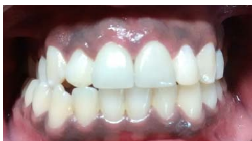
Figura 5. Rehabilitación de fracturas coronarias.

Cuatro semanas después del procedimiento descrito se evalúa la condición del paciente y se decide darle la alta periodontal. Se le remite al área protésica para que los dientes 11 y 21 sean reconstruidos mediante la cementación de endopostes radiculares de fibra de vidrio 22 , además de la conformación y el tallado del muñón coronario. Así, se toma la impresión definitiva con silicón, que es enviada al laboratorio para la conformación de las coronas libre de metal. Cuando finaliza este procedimiento se ajustan las coronas provisionales, respetando las consideraciones biológicas por razones estéticas; después de una semana se realiza el protocolo de cementación definitivo de las coronas libres de metal, recomendando al paciente continuar con un seguimiento del caso (figura 5).