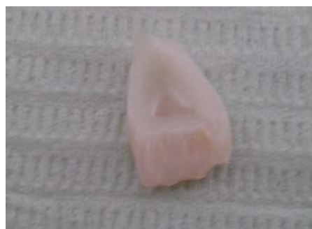
Figura 2. Fractura complicada corono-radicular.

Tomar 3 glóbulos cada 12 horas, durante 8 días; posteriormente, 3 glóbulos cada 24 horas, por 8