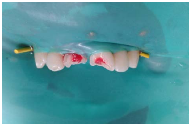
Figura 3. Fractura complicada de la corona 21 y corono-radicular complicada de 11.

La irrigación del conducto radicular se realiza con la preparación de 2% de tintura madre de Calendula officinalis y agua bidestilada. Se eligió esta sustancia irrigadora por tratarse de una biopulpectomía y eliminar el uso de los irrigantes habituales: hipoclorito de sodio y EDTA, sustancias que son irritantes para el ligamento periodontal al proyectarse por el periápice en el momento de la irrigación (figura 3).