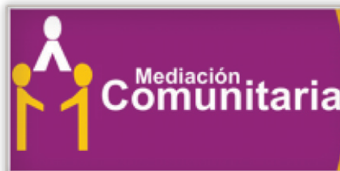
Figura 1. Mediación Comunitaria.

Si bien, todavía la sociedad aguascalentense recurre más al juicio que a la mediación, se tiene como hipótesis que la proporción número de juicios-acuerdos de mediación poco a poco comienza a emparejarse en el estado de Aguascalientes. Asimismo, se busca demostrar que el éxito de la mediación en sede judicial en ese estado es un factor que ha influido para crear programas de mediación, pero ahora en sede no judicial.