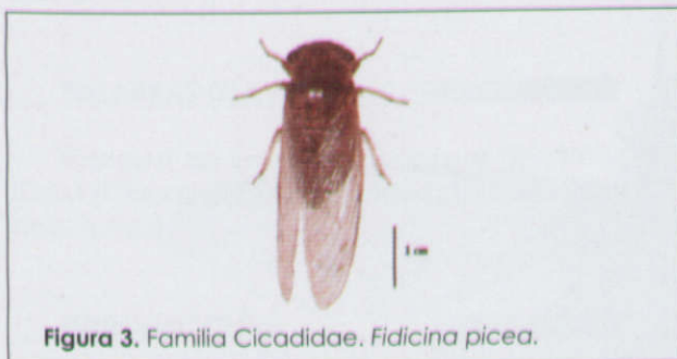
Figura 3. Familia Cicadidae. Fidicina picea .