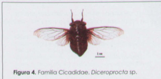
Figura 4. Familia Cicadidae. Diceroprocta sp.

ejemplares en la colección son Aphididae (232), Cicadellidae (68), Membracidae (55) y Cicadidae (21).