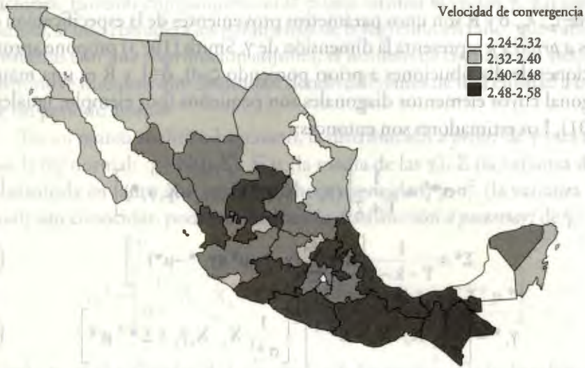
FIGURA 3 Velocidades de convergencia absoluta: estimaciones bayesianas iterativas (México, 1994-2002)