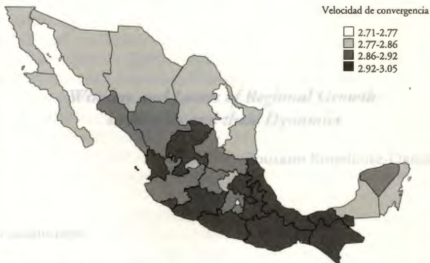
FIGURA 4 Velocidades de convergencia condicional: estimaciones bayesianas iterativas (México, 1994-2002)