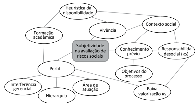
Figura 2. Framework de correlação dos principais fatores de interferência da subjetividade em avaliações de riscos sociais

A figura 2 ilustra o framework analítico proposto – que contempla os principais achados empíricos provenientes das entrevistas junto a especialistas em megaprojetos de alto impacto socioeconômico e ambiental – correlacionando os fatores de subjetividade que podem interferir no processo de avaliação de riscos sociais, proveniente da literatura.