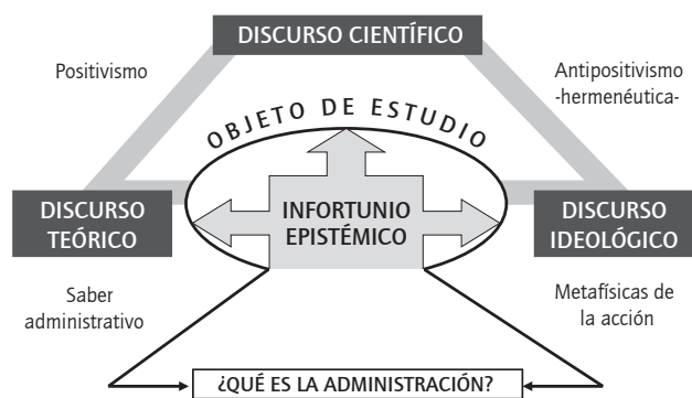
FIGURA 1. La polémica discursiva de la administración

Podría decirse que el estudio de la administración ha respondido a la introducción de nociones que responden a una hipóstasis dialógica, enmarcada en 1) un discurso científico, 2) un discurso teórico y 3) un discurso ideológico, lo cual ha conllevado un vacío de tipo epistemológico, eclipsando la esencia y naturaleza de lo que ontológicamente significa la administración (ver figura 1).