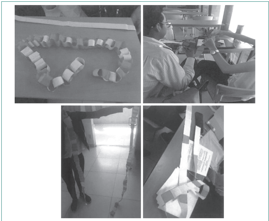
Figura 2. Actividades de elaboración de cadenas desarrolladas por los alumnos.

en el proceso de aprendizaje y debe de facilitar la conexión de ellos en las diferentes áreas, tanto personales, como profesionales.