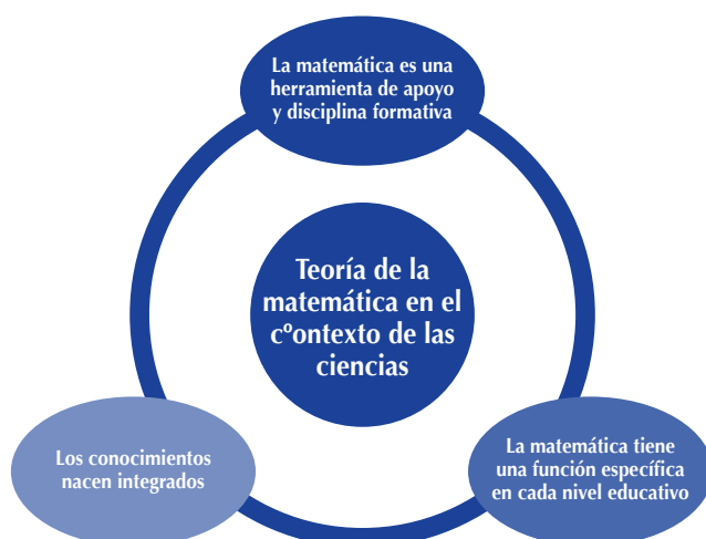
Figura 1. Fundamentos de la Matemática en el Contexto de las Ciencias.

La teoría se fundamenta (Camarena, 2000) en los paradigmas epistemológicos de conocimientos integrados y en la función de la matemática en profesiones en donde no es una meta por sí misma, es decir, en donde no se van a formar matemáticos; también se fundamenta en paradigmas cognitivos, sociales y educativos, los cuales, de forma agrupada se describen en la figura 1.