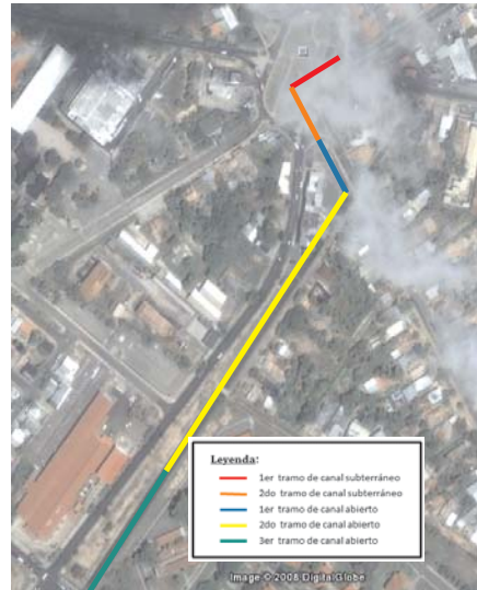
Figura 3. Representación fotográfica del canal en estudio dividido por tramos.

el flujo al tercer y último tramo del análisis, su valor aumenta a 44,2 \text{ m}^3/\text{seg} , al incorporarse el caudal proveniente de las sub-cuencas 5 y 6.