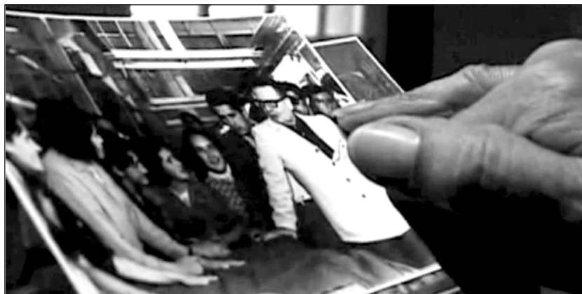
Imagen 2: Fotograma de obreros textiles de la fábrica Sumar, revisan una fotografía donde aparece Salvador Allende en una de sus visitas a la fábrica.

Constatamos que una de las prácticas de resistencia y sobrevivencia de los trabajadores/as frente a los allanamientos y destrucción de las memorias agenciados por la Dictadura, consistió en ocultar todo tipo de evidencia que los relacionara políticamente con la UP, pero, además, protegiera el recuerdo de bienestar y alegría experimentada. Así, documentos, libros, objetos, música, fotografías, entre otros, escamotearon al ojo represivo, ocultos bajo tierra y en el ‘doble fondo’ de muebles desvencijados. Junto con estos materiales y documentos, emergió el desarrollo de lo cotidiano al interior de