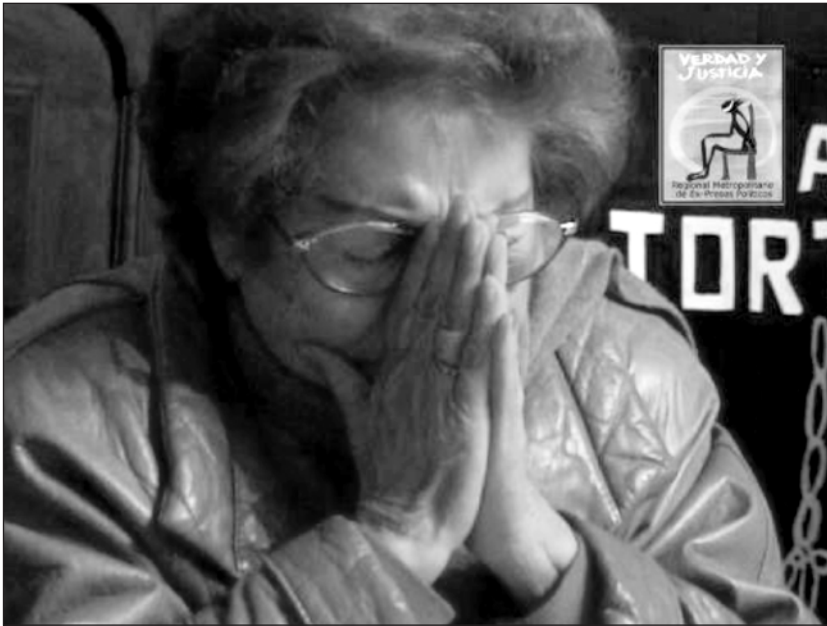
Imágenes 1: Fotograma de entrevista audiovisual realizada en un espacio colectivo.

los testimonios de sobrevivientes de torturas como experiencias biográficas que apelan a situar lo popular como vestigio de lo que fuera el proyecto personal-social del gobierno de la Unidad Popular (1970 -1973), e instan a comunicar y recomponer su sentido de comunión en una narración pública. En otras palabras, la narración se articula desde la voluntad de representar y comunicar audiovisualmente lo vivido a un interlocutor plural, que puede ser las generaciones futuras, los y las compañeros/as de la Agrupación, el Estado, o los grupos de oposición, por poner tan solo ejemplos (Imagen 1).