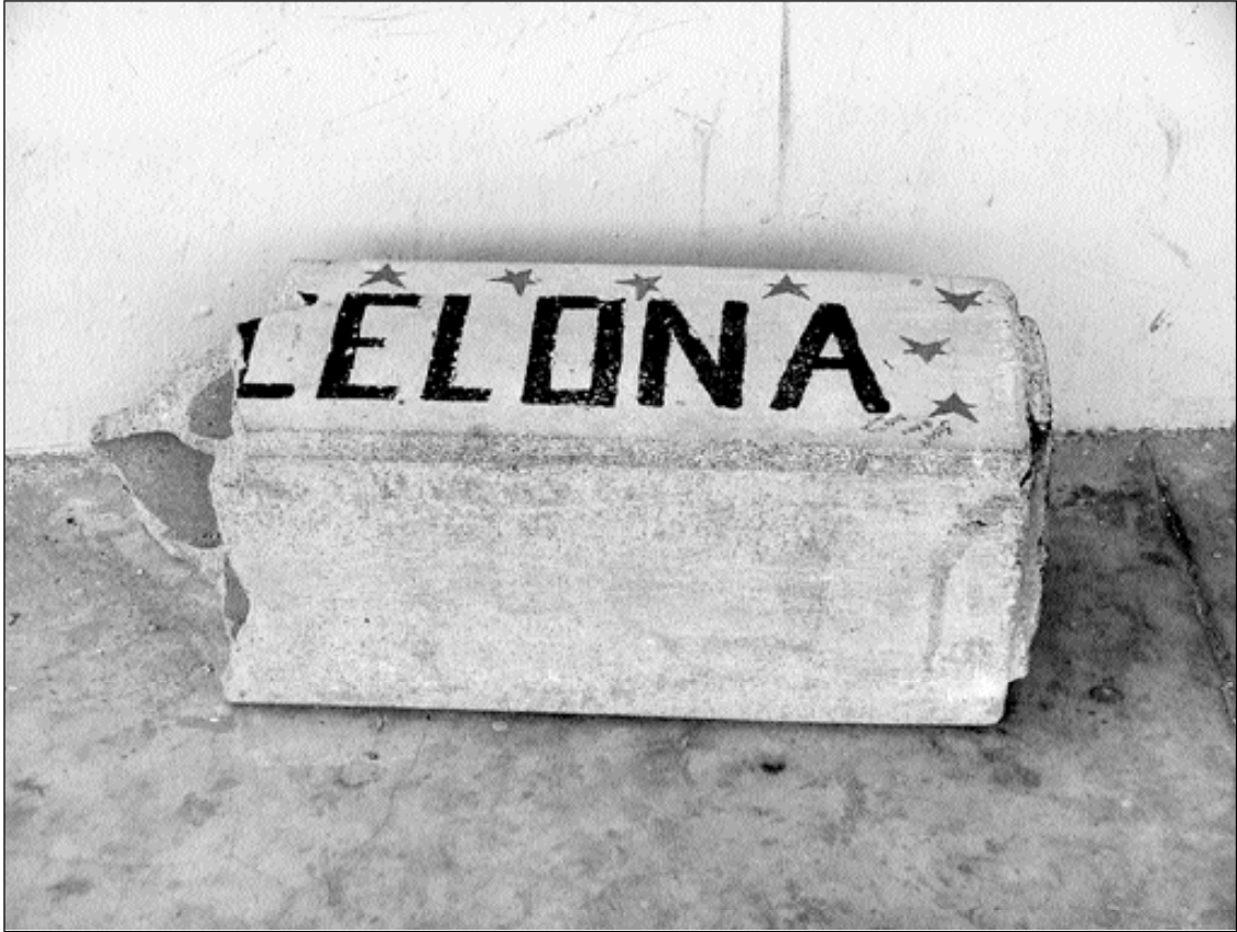
Silla Barcelona (Panamá y T. Martínez)