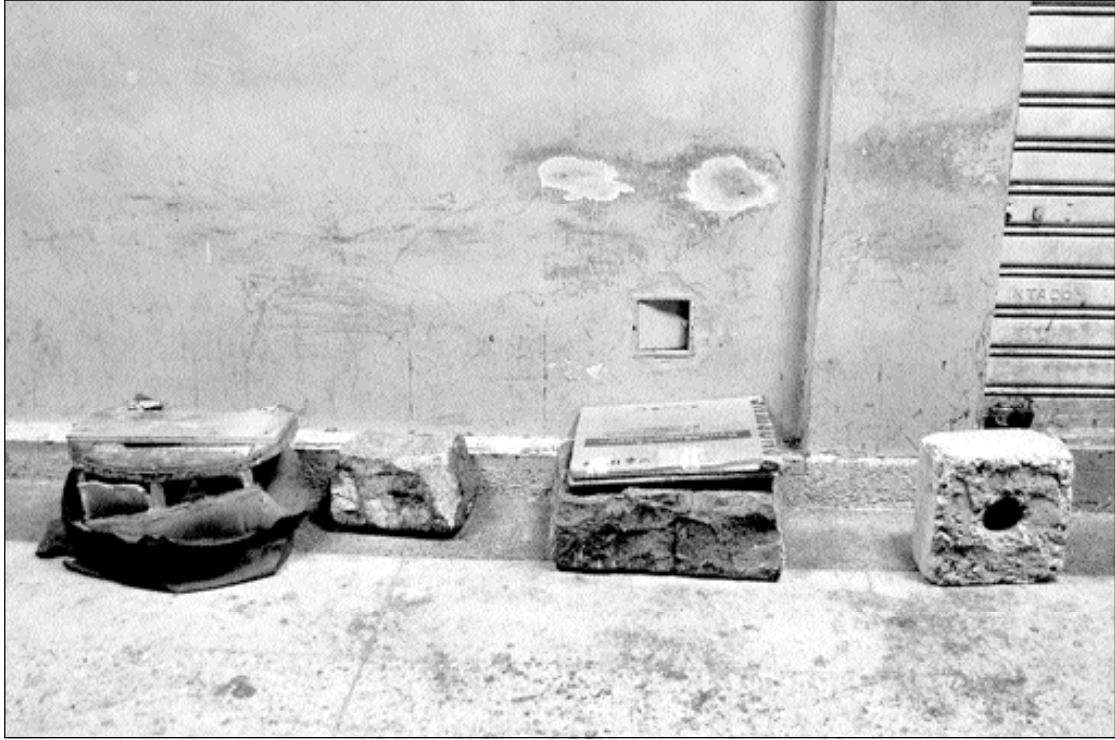
Cuidacarros (Panamá y Junín)