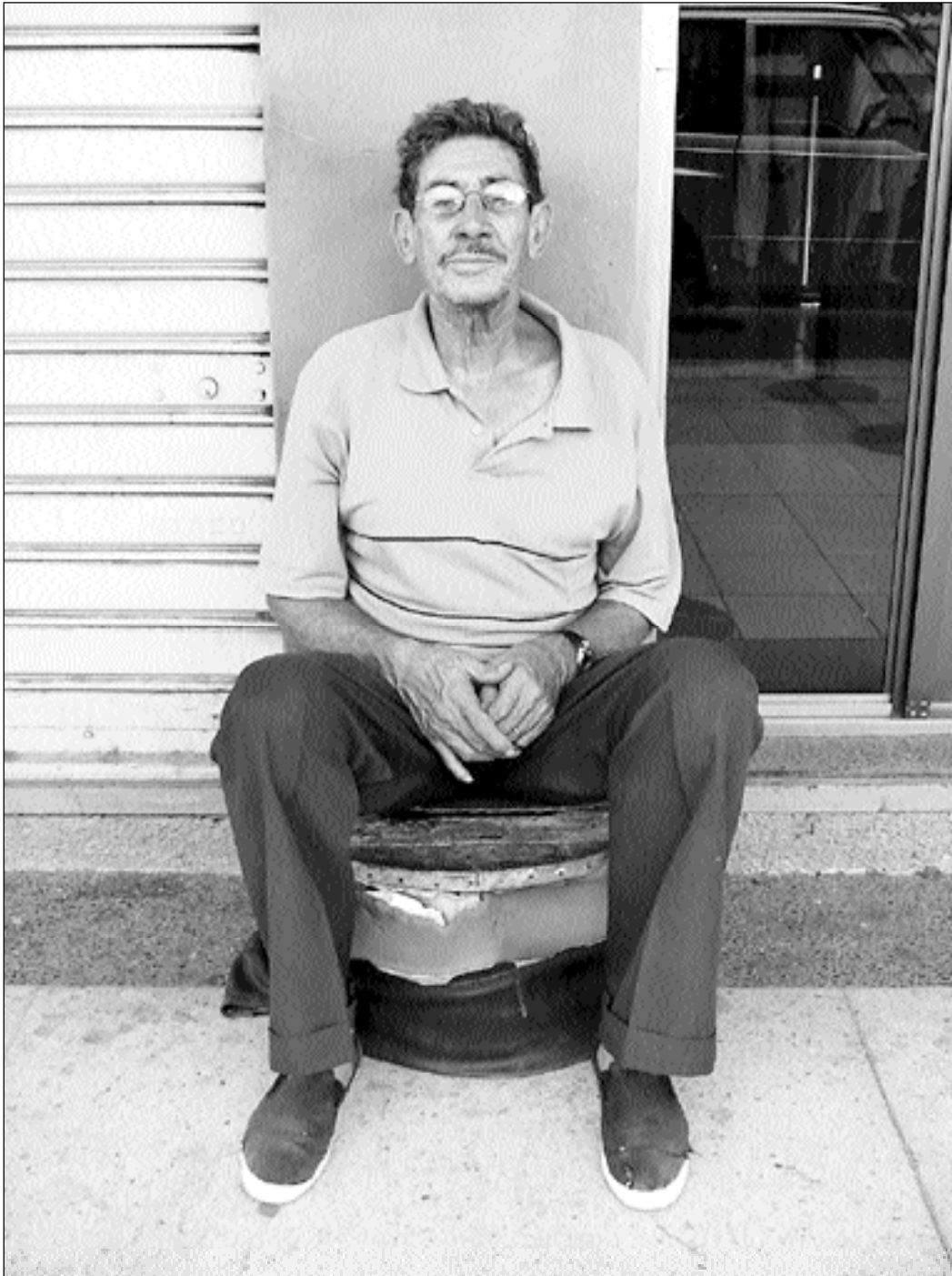
Hugo (Panamá y Junín)