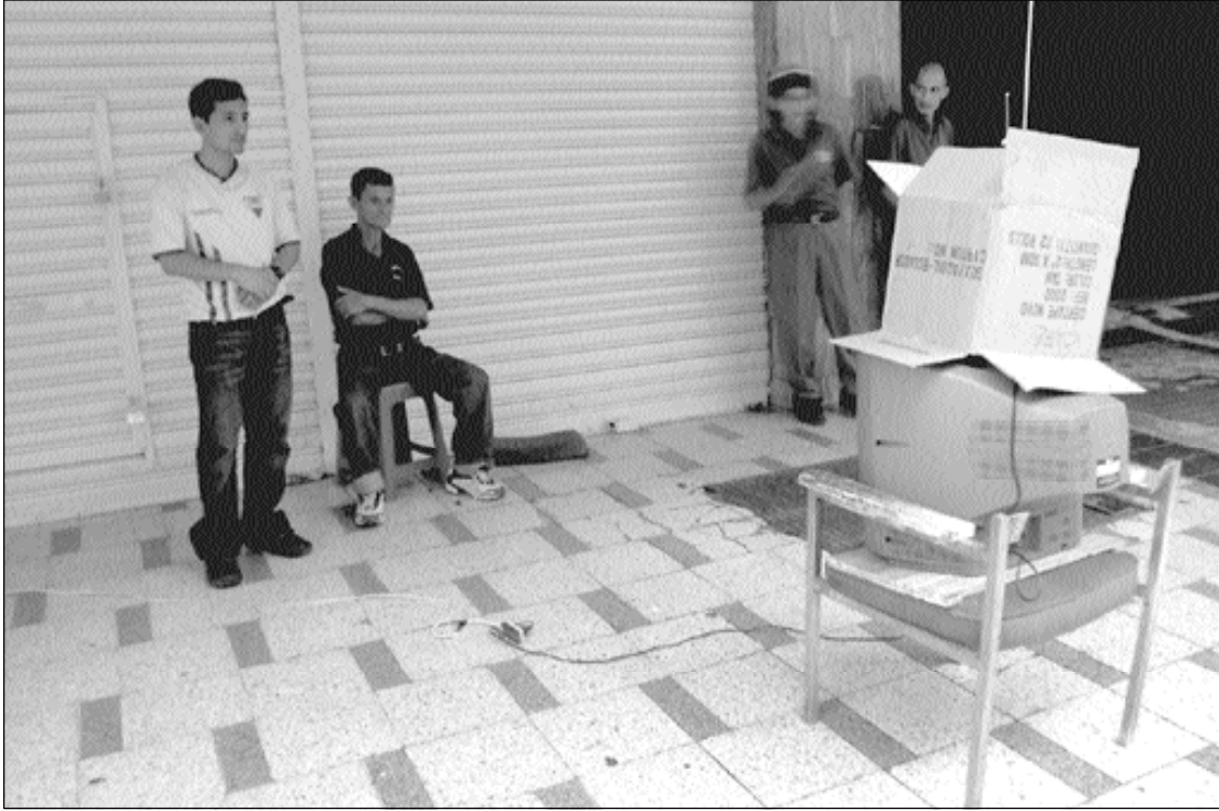
Salón de videos (Panamá y Sucre)