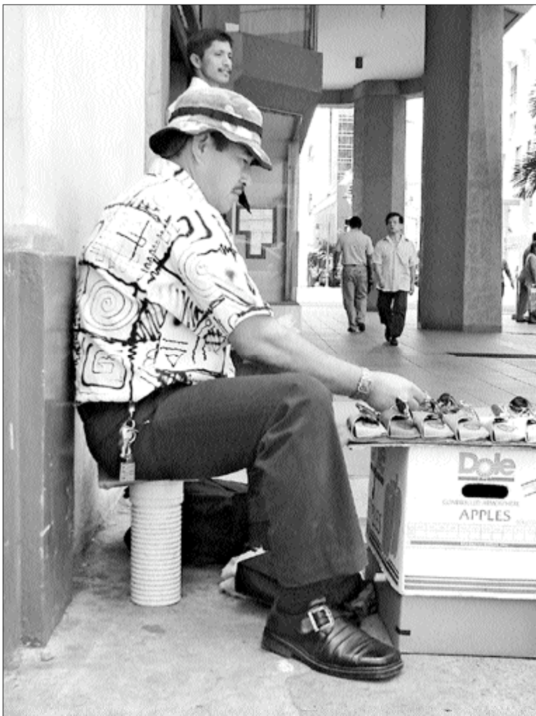
Vendedor de gafas (Panamá y Junín)