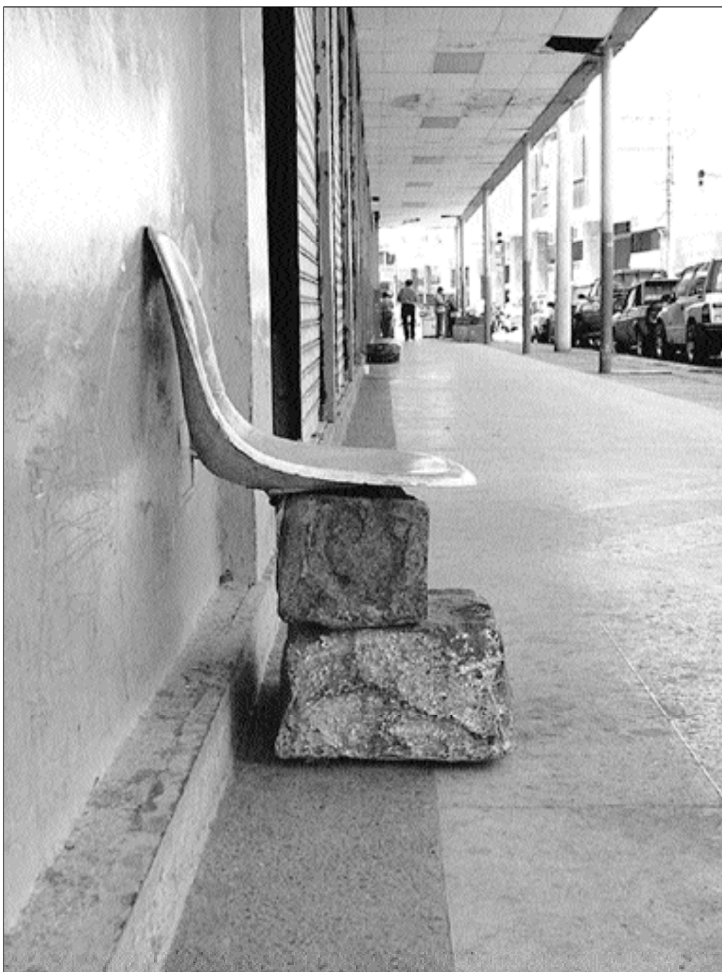
Ergonómico (Panamá y Junín)