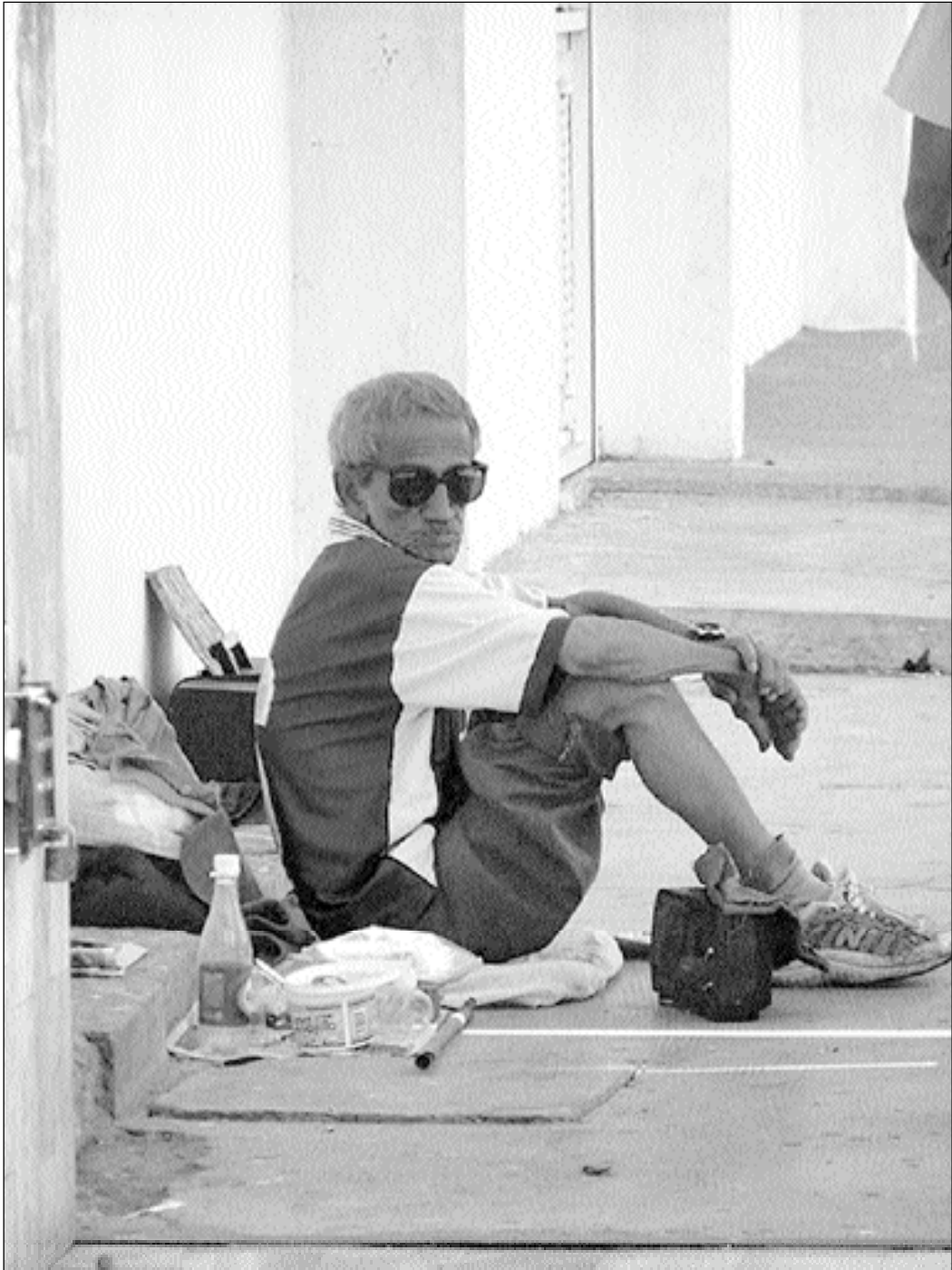
Residente (T. Martínez y Panamá)