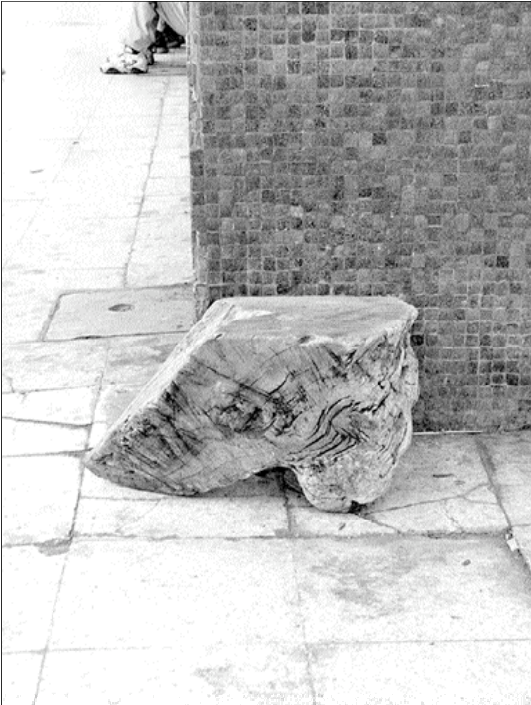
Esquinado (Rocafuerte y Juan Montalvo)