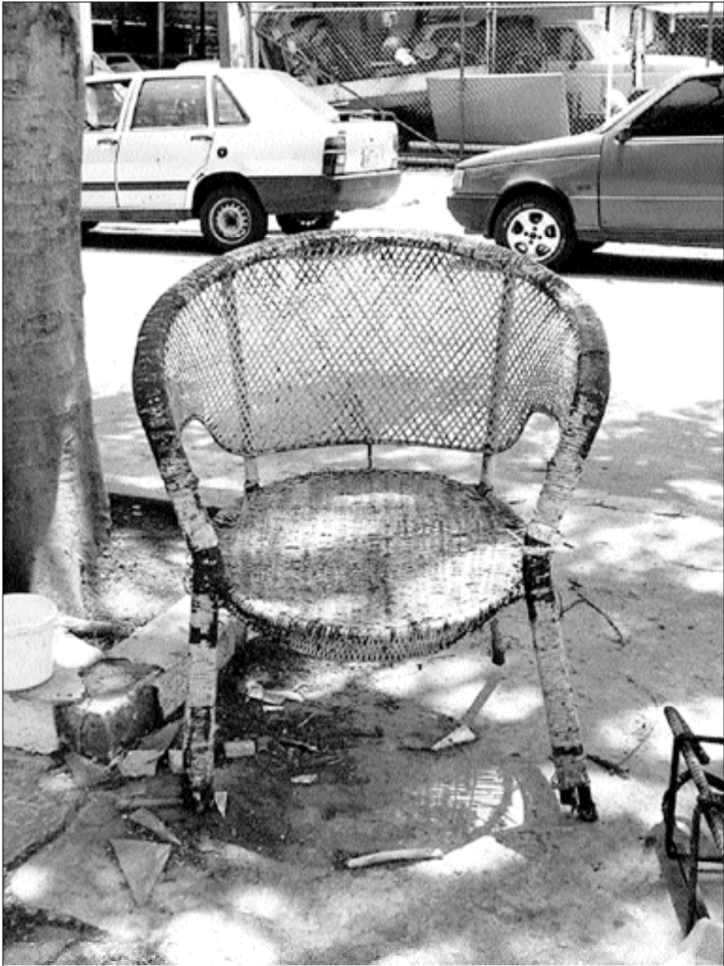
Parterizado (Rocafuerte y Juan Montalvo)