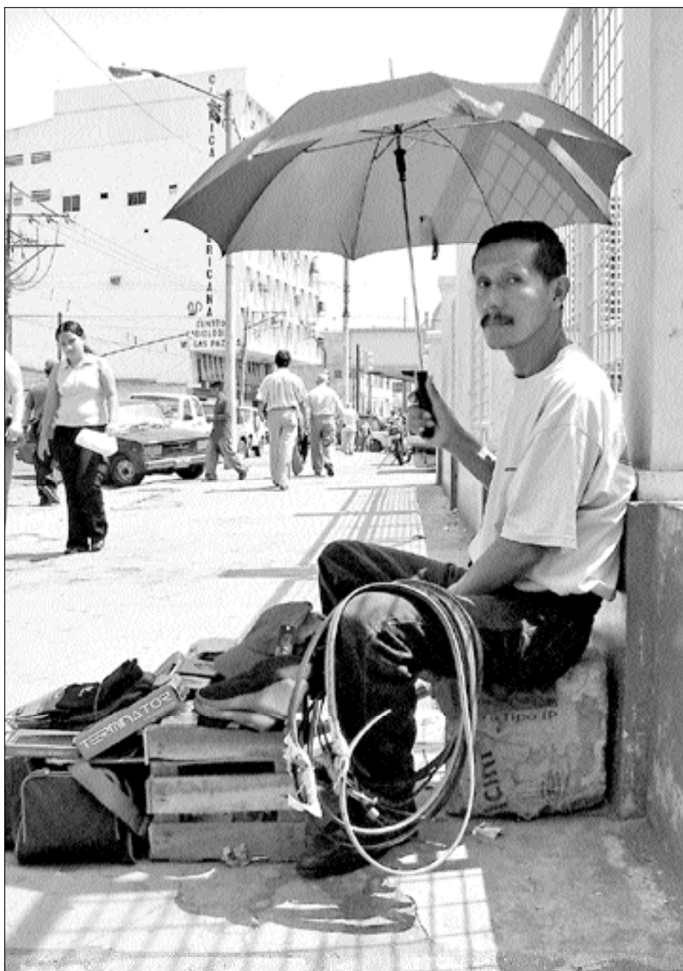
Vendedor de artículos de cuero (Panamá y Junín)