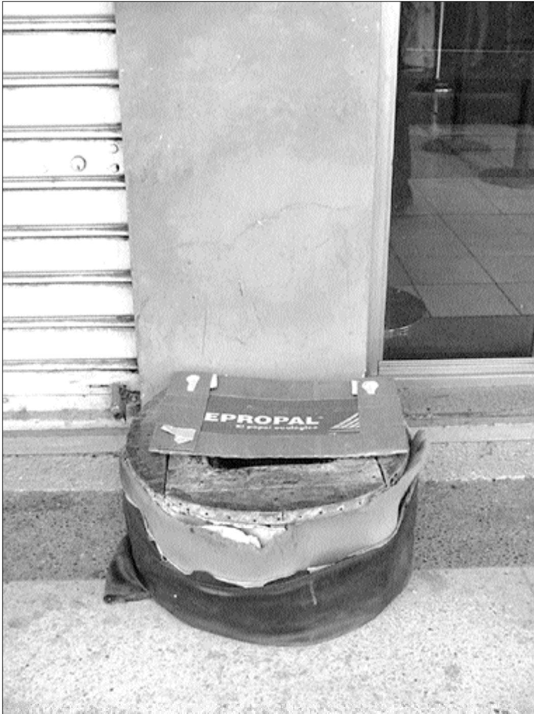
Sillón de Hugo (Panamá y Junín)