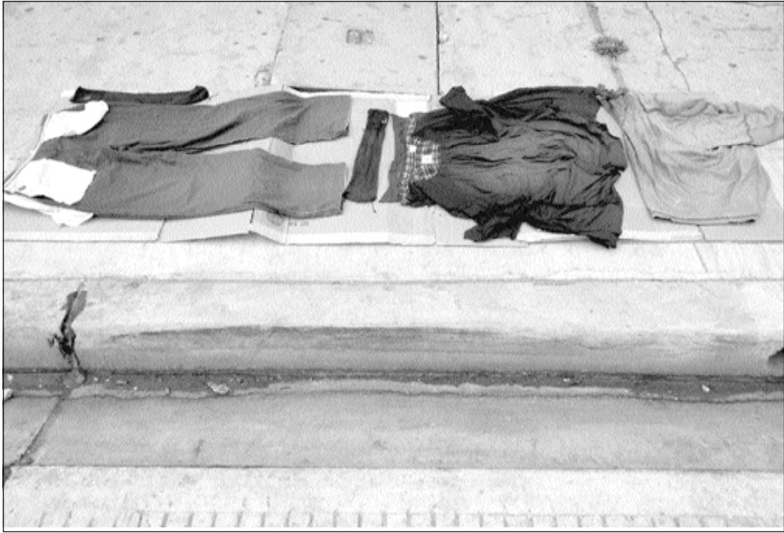
Lavandería (T. Martínez y Panamá)