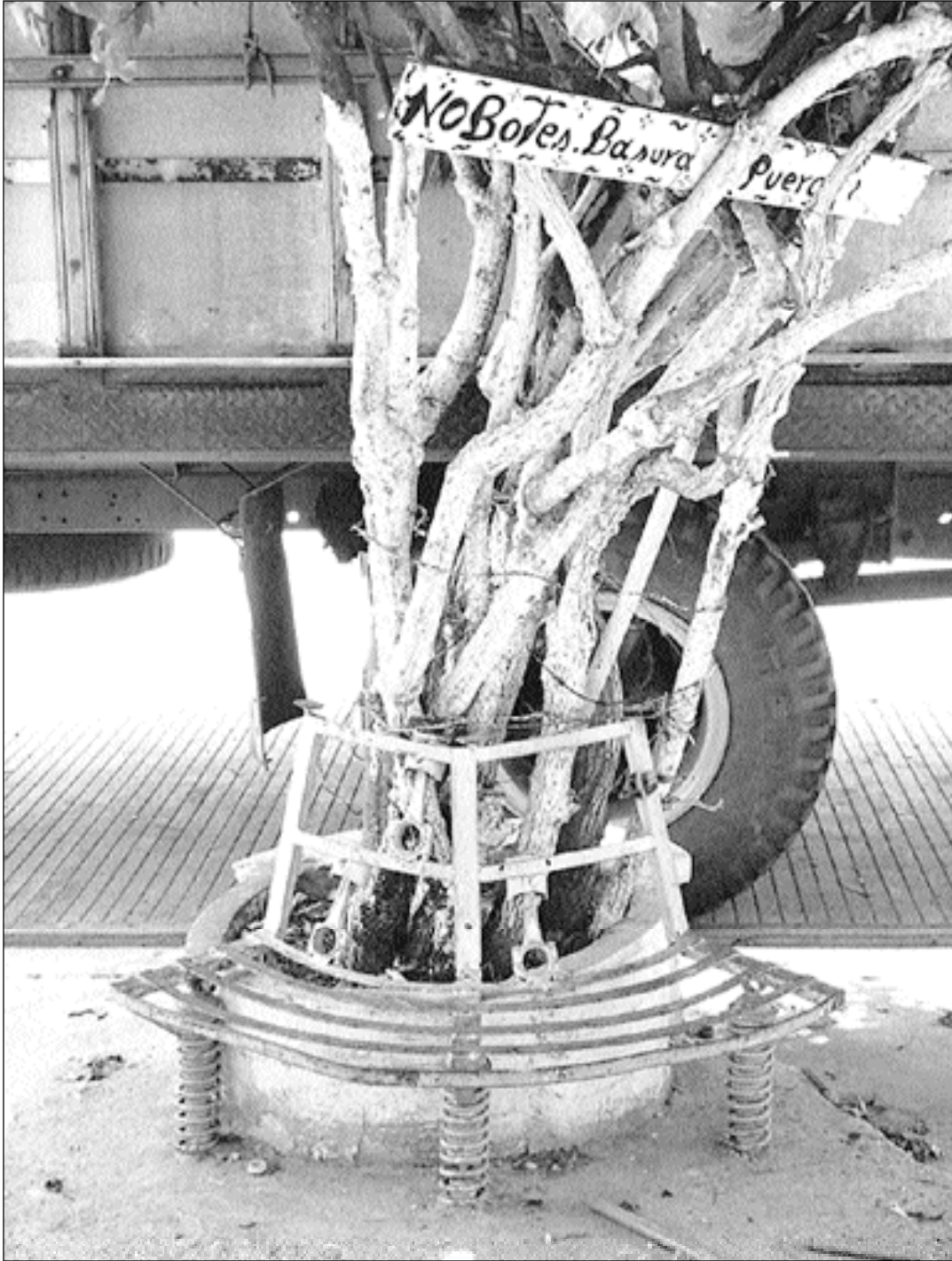
Descanso del mecánico (T. Martínez y Panamá)