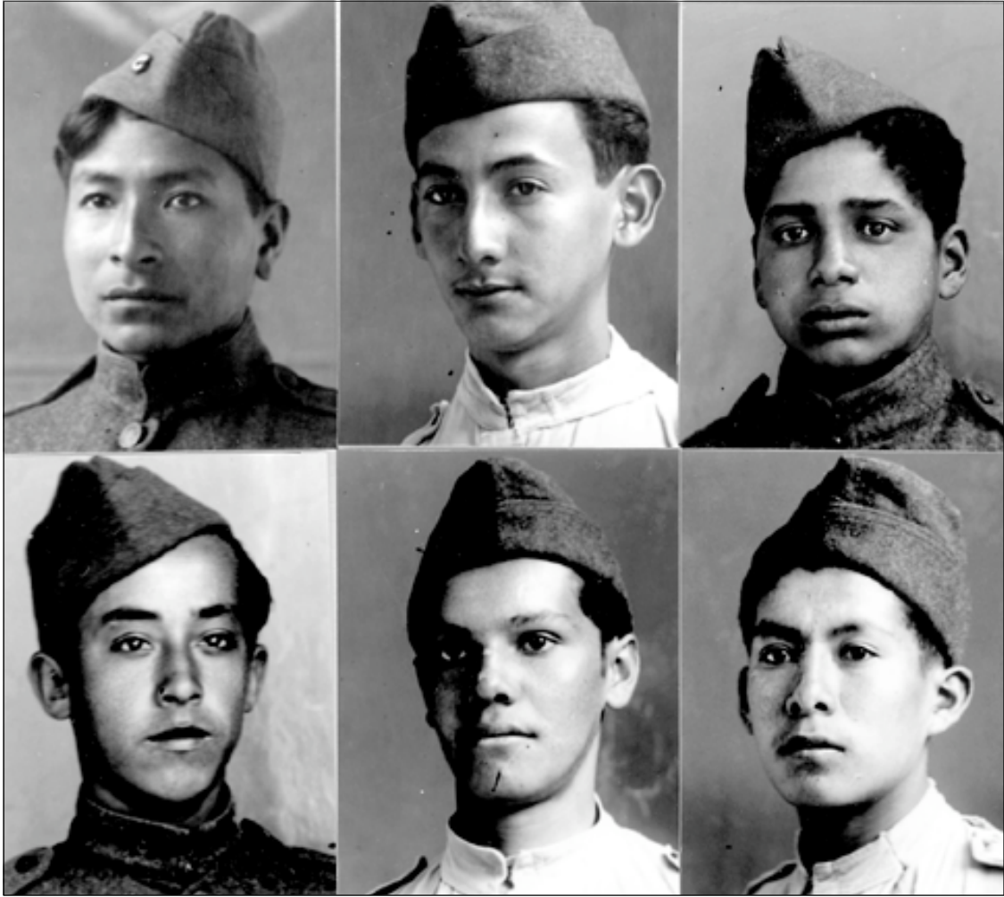
Fotógrafo: Fernando Zapata, Ecuador.