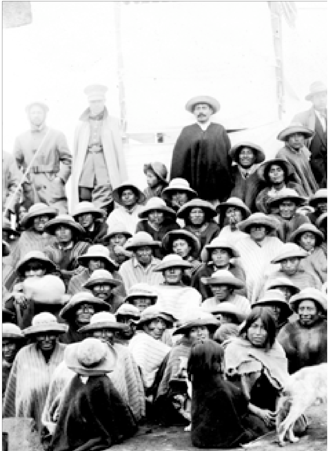
Militares en la comunidad indígena de Amula, Chimborazo, 1928