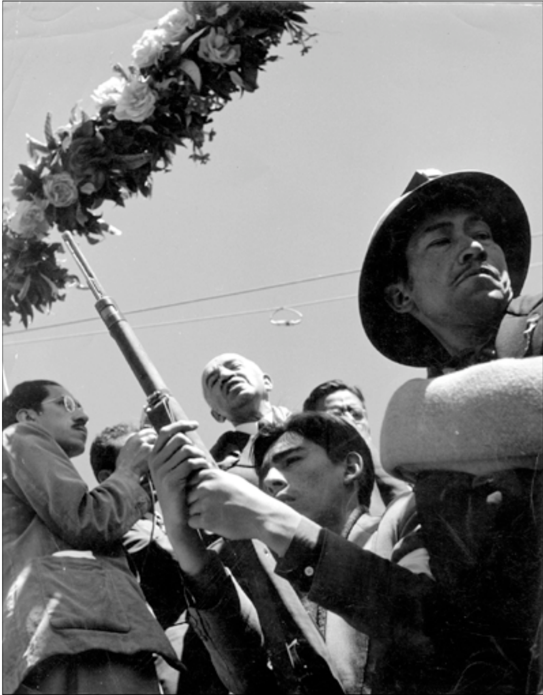
Fotógrafo: Thorlchten, La Paz, Bolivia