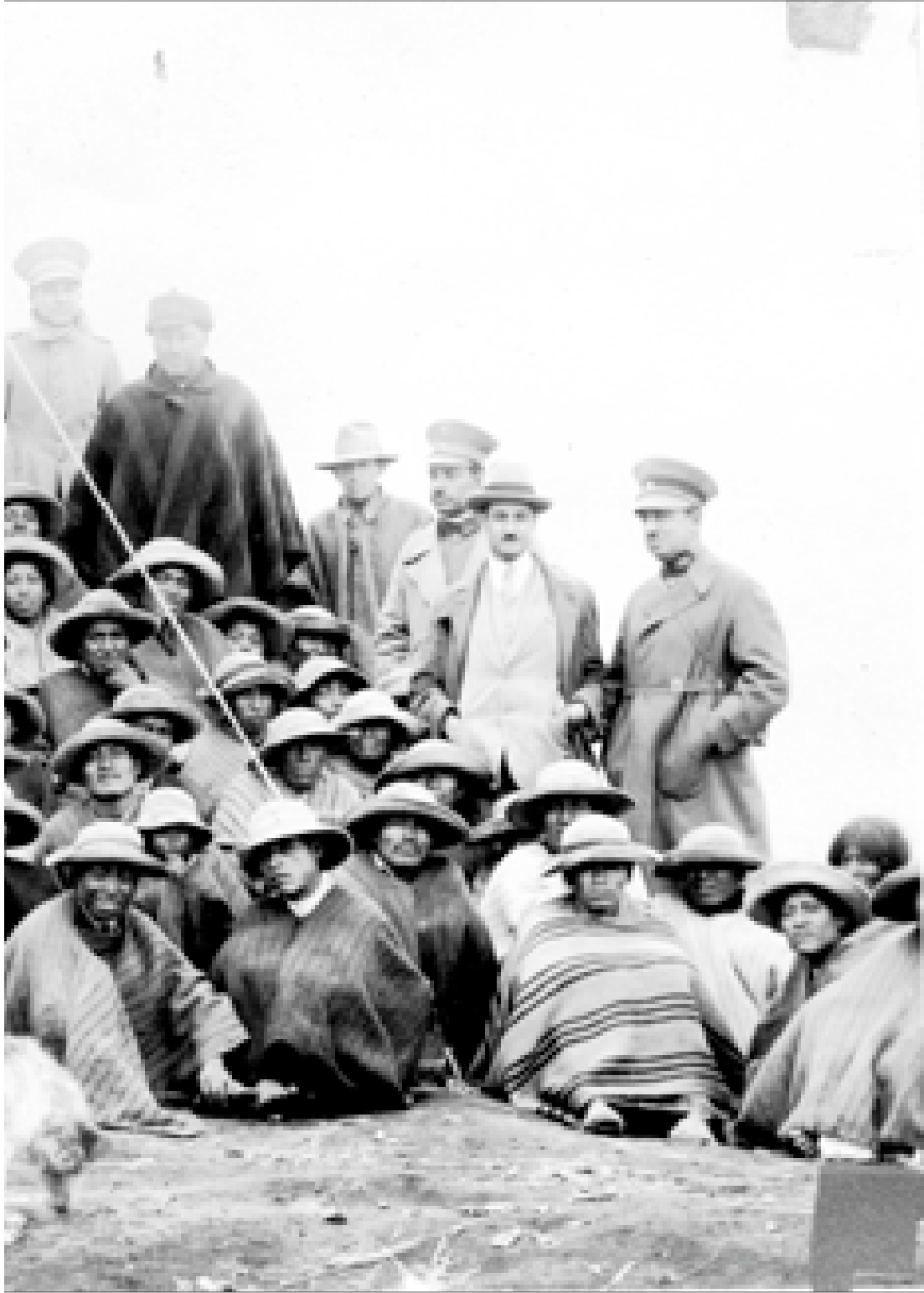
Fotógrafo: H. Donoso. Ecuador.