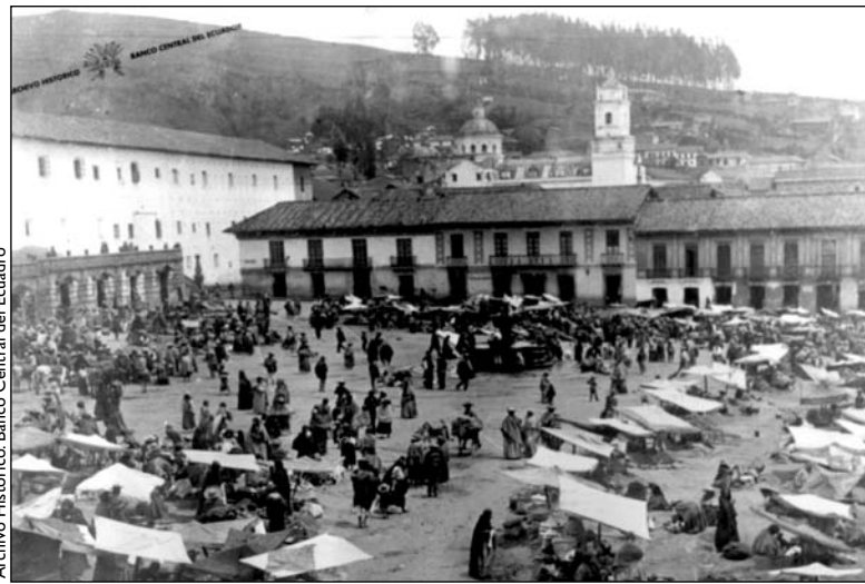
Quito, mercado en la plaza de San Francisco, hacia 1890

Concepciones diversas -y contradictorias- sobre la ciudad califican sus espacios y eligen el centro histórico como un espacio de reproducción cultural por excelencia. Es la vieja concepción de que hay una racionalidad en el organismo urbano, en donde ciertas áreas son de apropiación afectiva, aquellas que reconocemos con los posesivos “mi calle”, “mi barrio”, y donde también están otras áreas, aquellos no-lugares, cuyo ejemplo mayor es el centro de la ciudad, y dentro de él, la memoria, lo histórico. “Sin la ilusión monumental, a los ojos de los vivos, la historia no pasaría de ser una abstracción” (Augé 1994:68). Es en ese no-lugar, imposible de ser apropiado por los individuos pero que también es el lugar de