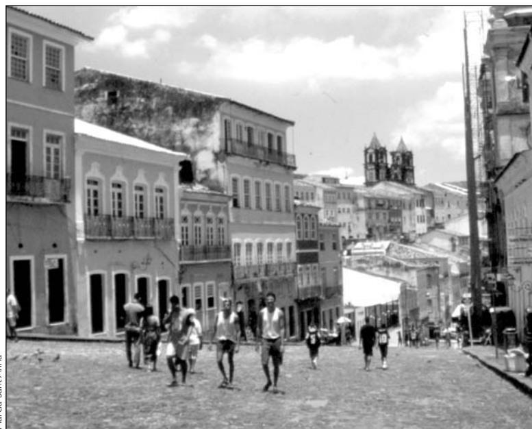
Vista del Pelourinho