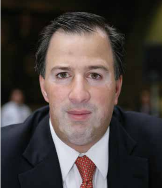
JOSÉ ANTONIO MEADE KURIBREÑA

Secretario de Hacienda y Crédito Público