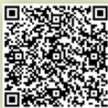
Imagen de un Código de Barras Bidimensional

Los contribuyentes podrán utilizar el nuevo modelo de facturación en papel durante 2011 si se encuentran en alguno de los siguientes escenarios: