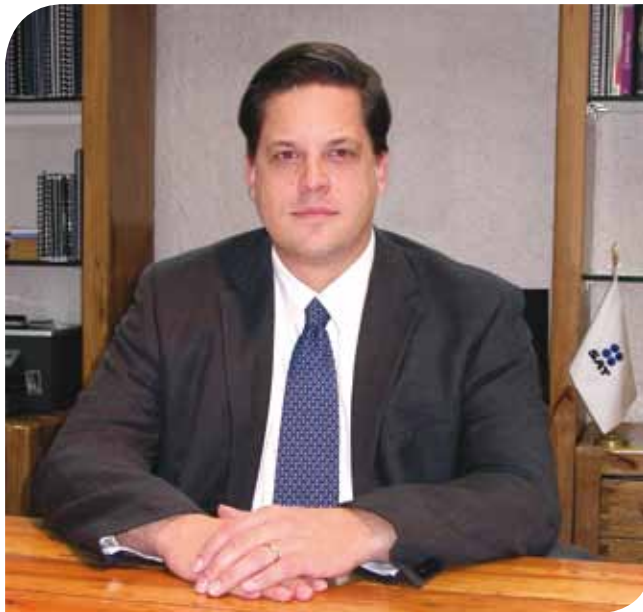
Lic. Alfredo Gutiérrez Ortiz Mena Jefe del Servicio de Administración Tributaria

La dimensión social de los impuestos, sustentado en la aportación solidaria en beneficio del conjunto social, es un elemento casi impercibible por los ciudadanos, que aunado al desequilibrio entre los impuestos y la satisfacción de las necesidades públicas, forma parte de una determinada cultura en la que la práctica de la evasión y la elusión fiscal se conciben como mecanismos “legitimados” para no cumplir con las obligaciones fiscales.