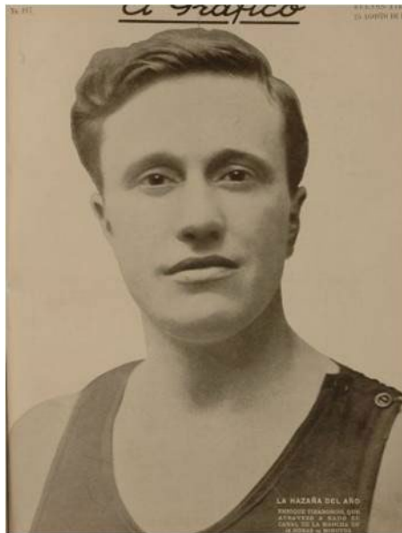
Figura 3. La hazaña del año