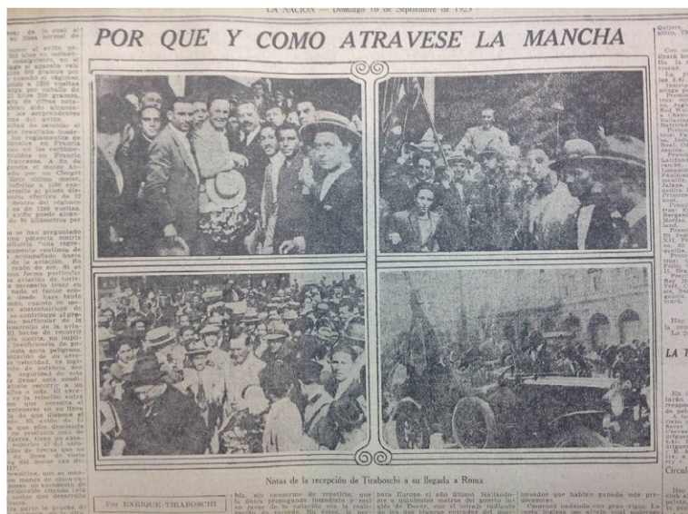
Fuente: La Nación , 16 de septiembre de 1923, 3.