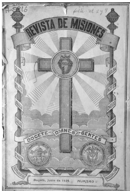
Figura 1. Primera portada de la Revista de Misiones , junio de 1925.

Según un artículo que conmemora los cincuenta años de su existencia, la Revista de Misiones "jamás ha hecho sensacionalismo, sino que por el contrario, llegando silenciosa y modestamente a los hogares colombianos, ha sabido defender a misioneros de sensacionalismo calumnioso de diarios matutinos y vespertinos. No sabe de alharacas huecas sino que registra hechos que luego son historias" 34 .