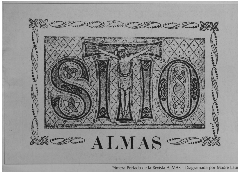
Figura 2. Primera portada de la revista Almas , abril de 1936.

primera portada, en la que puso la palabra Sitio , que bajo la letra T muestra un Cristo crucificado. Sitio es el lema de la congregación, que significa "tengo sed" 44 (Figura 2).