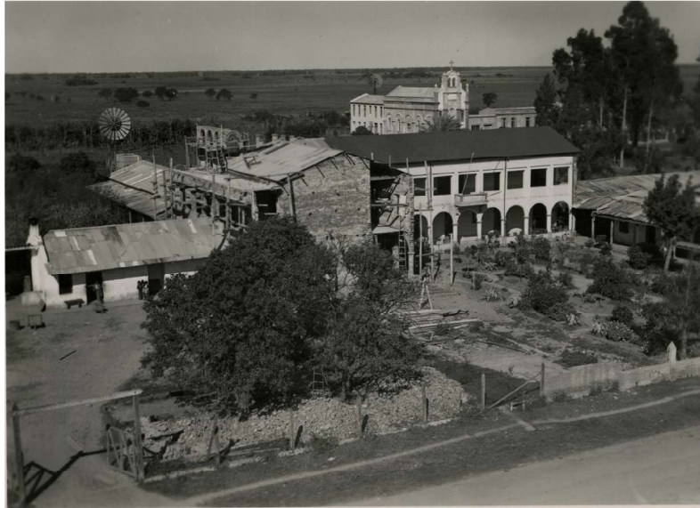
Imagen 1. Misión Laishí, Formosa