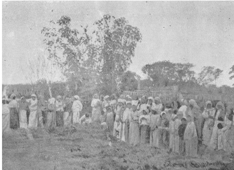
Imagen 12. Esperando el reparto de ropa