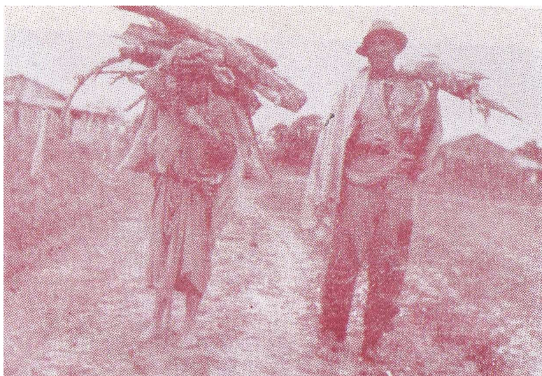
Imagen 8. Matrimonio toba regresando del bosque, Misión Laishi