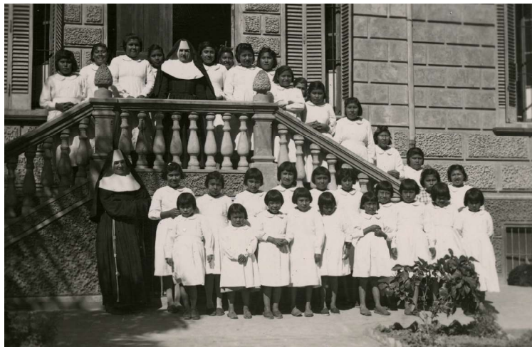
Imagen 4. Aborígenes en la Misión Laishí, Formosa

En el grupo que aparece en la imagen 4, se cuenta una totalidad de 32 niñas qom de diferentes edades, vestidas cada una con un prolijo delantal blanco, y situadas en la escalinata de acceso frente al edificio escolar.