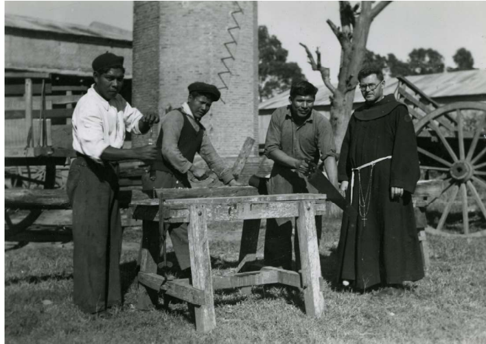
Imagen 5. Escuela de oficios para aborígenes, Formosa

operan a modo de estereotipos naturalizados y, por lo mismo, invisibles. Este entramado de significaciones atraviesa y marca los cuerpos y diseña anhelos, deseos, discursos y posibilidades a partir de los cuales se presentan los horizontes de sentidos desde donde los sujetos se posicionan y actúan.