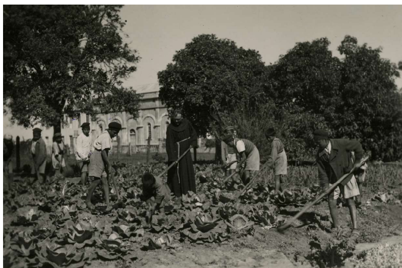
Imagen 6. Aborígenes trabajando, Misión Laishí

franciscanos, por medio de un sistema de castigos y penas para asegurar la productividad y evitar que los indígenas abandonaran la Misión.