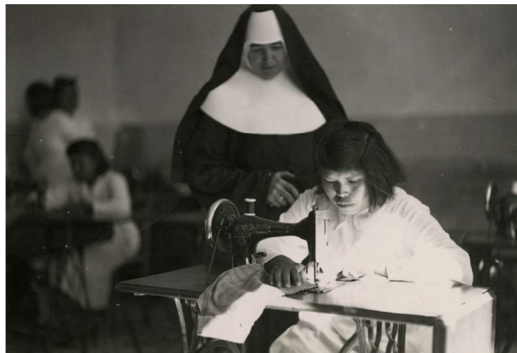
Imagen 7. Escuela de oficios, Formosa

En la cita del fraile podemos observar la vinculación directa entre la salida del internado y la inserción de estas niñas en una vida adulta entendida como normalizadora. La donación del ajuar orienta el futuro trabajo que estas jóvenes tendrán (ver la imagen 7). Y, en ese marco, la confección de ropas y la costura en general van a ser tareas claves que pueden, además, ser realizadas por las indígenas sin desplazarse de los hogares.