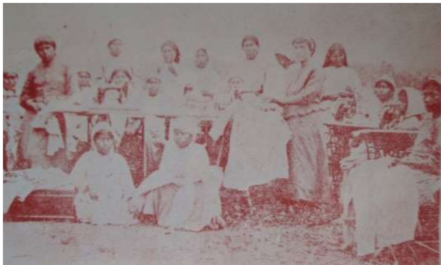
Imagen 10. Mujeres tobas de la Misión Laishí en la clase de corte y confección con su directora

Fuente: José Elías Niklison, Los tobas , 136.