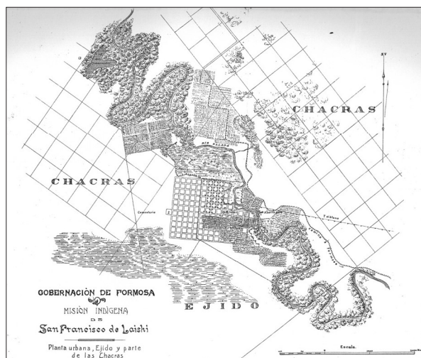
Mapa 2. Mapa de la Misión