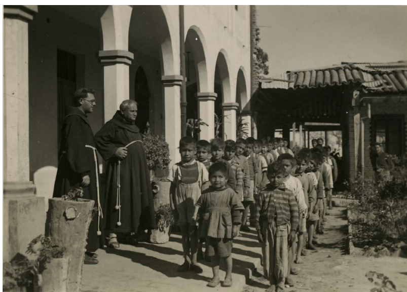
Imagen 2. Escuela aborigen Misión Laishí, Formosa

por gestiones de fray Pablo Rossi 41 . Después, en 1939, se fundó el internado para varones, a cargo de los franciscanos. Las dos escuelas tenían internos y externos. Según la reconstrucción de Dalla Corte 42 , los niños ingresaban a los seis años y permanecían allí hasta los 14 (ver la imagen 2). Las niñas permanecían entre los tres y los 17 años.