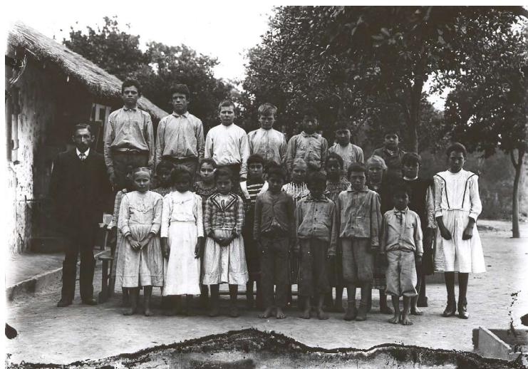
Imagen 3. Niños y niñas en un internado, provincia del Chaco