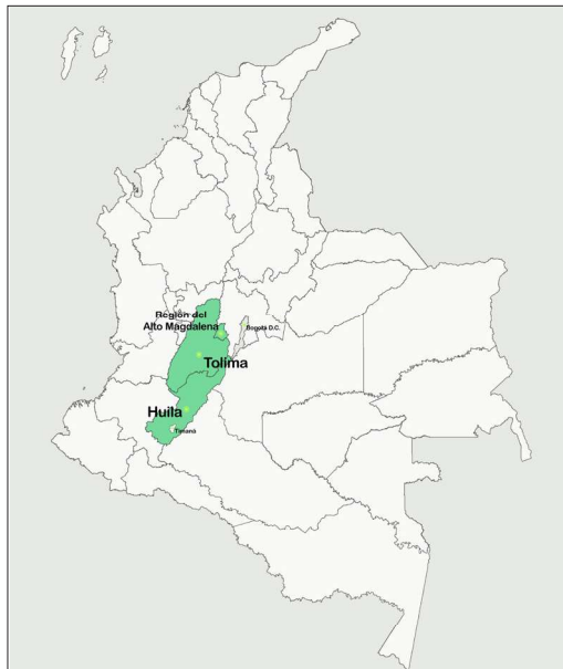
Mapa 2. Región del Alto Magdalena actual