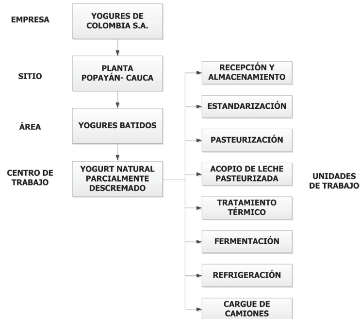
FIGURA 1. Modelo jerárquico de equipos de la empresa “Yogures de Colombia S.A”

niveles inferiores que realizan funciones de producción, en el centro de trabajo se elabora el producto a través de ocho unidades de trabajo o segmentos de proceso: Recepción y almacenamiento, estandarización, pasteurización, acopio de leche pasteurizada, tratamiento térmico, fermentación, refrigeración y cargue de camiones cisterna [15]. La información de elaboración del Yogurt de esta empresa se emplea en el desarrollo de los modelos programa de producción y desempeño de producción basados en la parte 1 y 2 del estándar ANSI/ISA 95, para posteriormente aplicarles la parte 5.