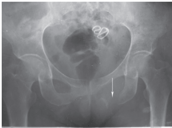
Figura 2. Osteolisis del isquion izquierdo.