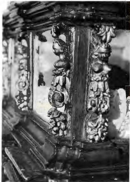
Fig. 98. Detalle de la urna.