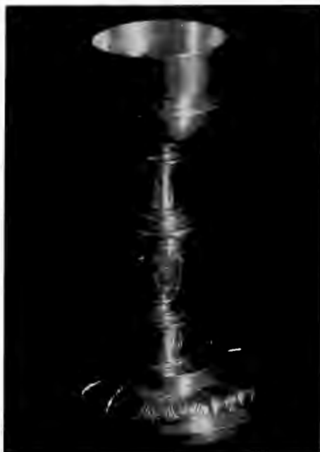
Fig. 92. Cáliz. Plata sobredorada. Siglo XVII, quintado. 25.8 × 25.6 cm.

Un punto importante en este registro es la relación de las alhajas de plata que tenía la parroquia de San Pedro al momento de llevarse a cabo el Inventario. Una custodia abre el registro —debe tenerse en cuenta