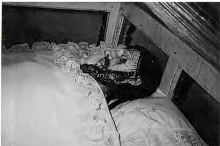
Fig. 99. Detalle del Cristo del Santo Entierro .

señalar, aparece una anotación al inicio del documento —que no corresponde con la forma de hacer los números en la época colonial; parece más bien de época actual— donde quedó consignado el año de 1746. Si esta fecha es la correcta, se trata del primer Inventario con que se cuenta, en orden cronológico, de la parroquia nueva de Señor San Pedro. Al analizar su contenido se advierte que los altares estuvieron dedicados a los siguientes personajes sagrados: el mayor, a san Pedro, y los restantes al Santo Cristo de Roncesvalles, a la Purísima Concepción, al Señor san José, a san Isidro, a la Virgen de los Dolores, y a las Benditas Ánimas del Purgatorio. Algunas dedicaciones de los altares son las mismas que se consignan en el Inventario de 1781. Ahora bien, el altar dedicado a venerar a Nuestra Señora de la Luz sólo se registra como tal en el fechado en 1781. La ausencia en este Inventario de un altar dedicado a esta devoción jesuita refuerza la posibilidad de que la fecha de 1746 sea la correcta, puesto que el auge de la devoción en cuestión pertenece propiamente a la tercera década del siglo XVIII, y resulta imposible encontrar un altar o pintura de la Virgen de la Luz en un lugar situado tan al norte del virreinato en una fecha tan temprana como lo es la de 1746. Cualquiera que sea el orden de las fechas de la documentación, el hecho es que este