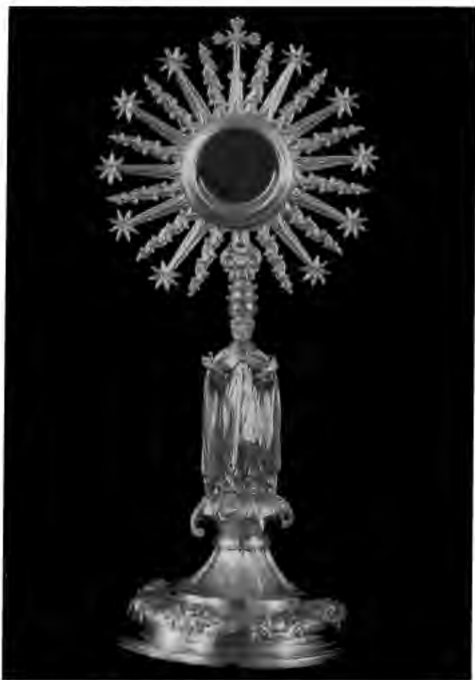
Fig. 93. Custodia. Plata sobredorada con detalles pintados o esmaltados. 1732. 61.5 × 25.6 cm.

que, por lo general, las piezas más ricas en su género dan inicio a los diversos apartados del Inventario, enseguida aparecen mencionadas las piezas de menor importancia. Es casi seguro que esta magnífica pieza de orfebrería, a que se hace alusión en la primera partida de las alhajas de plata de la iglesia, se ha conservado hasta el día de hoy en la parroquia de Valle de Allende. Uno de los tesoros actuales de esta iglesia es precisa-