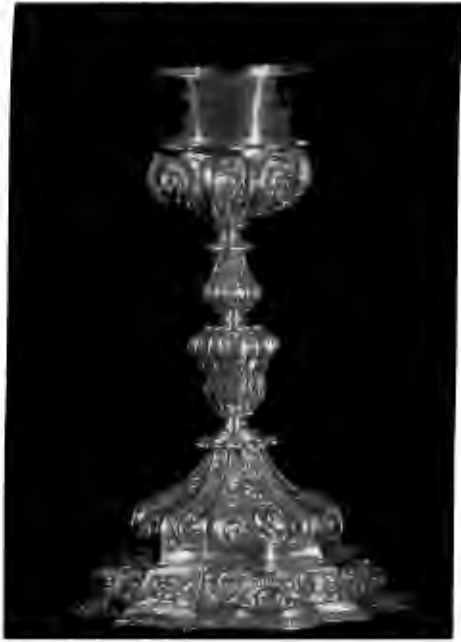
Fig. 96. Cáliz. Plata sobredorada. Siglo XVIII. 23.5 × 15.3 cm.

daron integradas a él cuatro pantallas de marco dorado, con sus vidrieras, dos largas y las otras dos angostas. Sobre el punto anterior vale la pena recordar el espléndido retablo pintado, obra de Antonio de Torres, que se conserva en la parroquia de Parral, ciudad muy cercana a Valle de Allende, que ya ha sido mencionado líneas atrás.