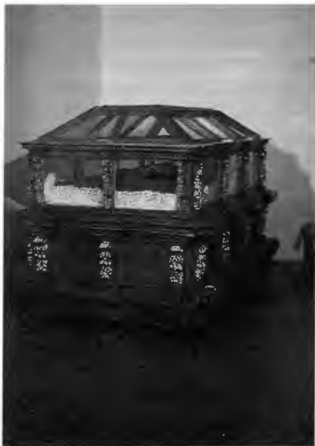
Fig. 97. Urna del Santo Entierro . Madera tallada y dorada. 1.30 x 2.21 x 1.36 m.