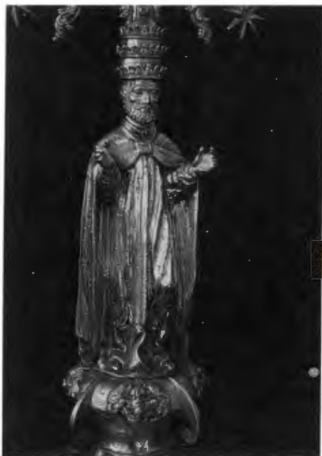
Fig. 94. Detalle de la custodia.