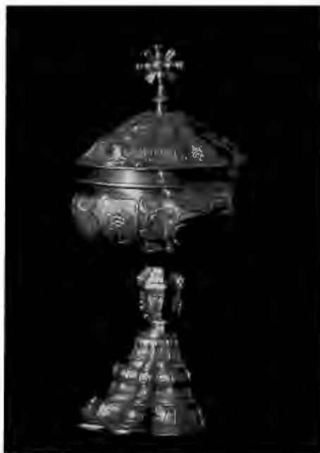
Fig. 95. Copón. Plata sobredorada. Siglo XVIII. 25.6 × 12.3 cm.

es de fecha posterior, debe tratarse, entonces, de la misma custodia. La inscripción que ostenta, al ser leída con las abreviaturas desatadas, dice lo siguiente: “Se hizo siendo cura y vicario de este Valle el doctor don Antonio Joseph Melo, abogado de las Reales Audiencias de estos reinos, y examinador sinodal de este obispado. Año de 1732”. Como ya quedó asentado líneas atrás, en el pie de la custodia se observa la representación de san Pedro, en calidad de primer Papa de la cristiandad. Se trata de una pieza de gran belleza y calidad artística. El rayo de la custodia presenta rico movimiento en los haces de un sol barroicamente trabajado.