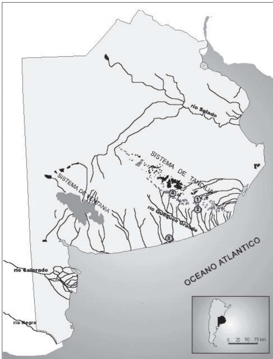
Figura 1. Mapa de ubicación de los sitios y fuentes de materia prima: 1) Cerro El Sombrero; 2) Cerro La China; 3) El Guanaco; 4) Arroyo Diamante.

La segunda, es la posibilidad de diferenciar las rocas de cada una de estas áreas de abastecimiento. Esto es particularmente importante en el caso de las rocas cuarcíticas porque proceden de ambos sistemas serranos, y son las de mayor interés arqueológico. En trabajos previos planteamos que estas rocas se pueden distinguir petrográficamente ya que las del sistema de Tandilia son sedimentarias (ortocuarcitas) y las del sistema de Ventania son metamórficas (metacuarcitas) (Bayón et al. 1999). Las materias primas disponibles en la cos-