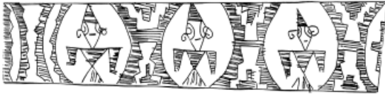
Figura 9. Personajes de cabezas romboidales y gorros cónicos.