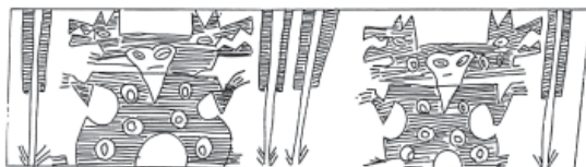
Figura 6. Personajes con felinos.