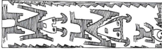
Figura 10. Personajes con adornos cefálicos en forma de ancla.