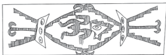
Figura 2. Personaje con máscara felínica.

El tipo denominado “Personaje con máscara felínica” está presente en nuestra muestra a través de dos piezas (Figuras 2 y 3).