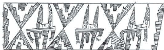
Figura 8. Personaje con máscaras no identificadas.

respondería con el Personaje Flanqueado por Felinos. Dentro de este grupo proponemos diferenciar dos modos de representación: