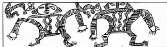
Figura 1. Pieza 11784: muestra manos circulares y dedos hechos con líneas.

Para el análisis del material se tomó como punto de partida la descripción establecida por González