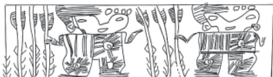
Figura 4. Personajes con armas.