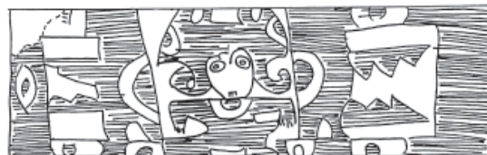
Figura 7. Personaje con felinos.