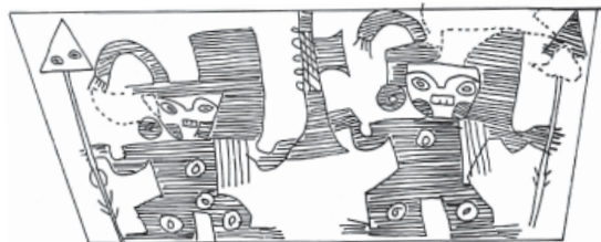
Figura 5. Personajes con armas.