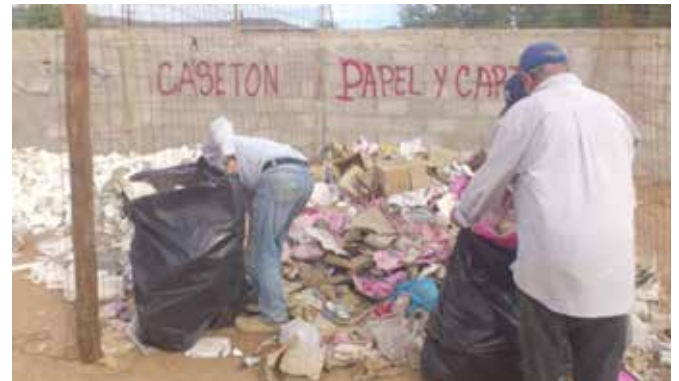
Figura 7. Cartón y papel.

E) Residuo de cartón-papel: Material reciclable producto de embalajes, sacos de envoltura de cementantes, cerámicos, entre otros.