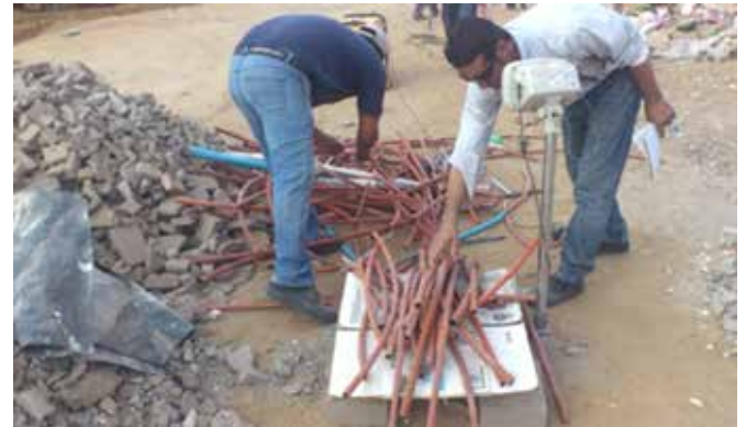
Figura 6. Plástico-poliducto.

D) Residuo de plásticos-poliducto naranja: Material producto del corte y/o desperdicio, así como de la actividad de demolición-deconstrucción.