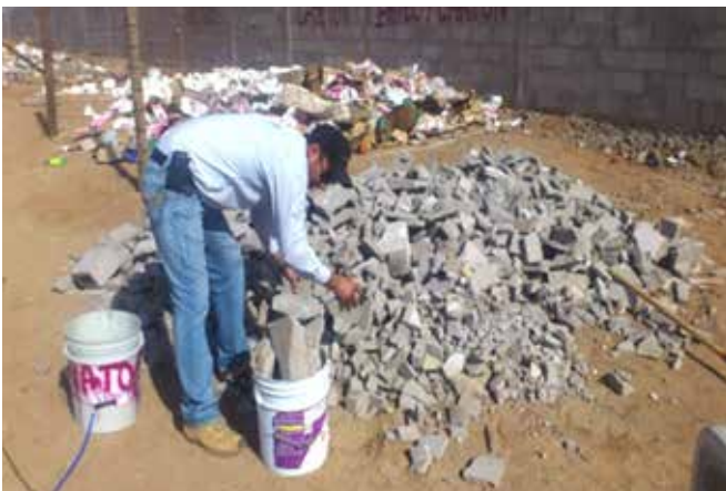
Figura 5. Recolección de block.

C) Residuo de block: Material generado por la fabricación, manejo y colocación de block.