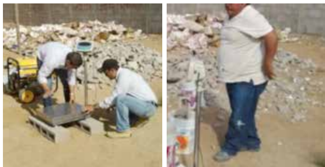
Figura 9. Instrucción del personal que recolecta y pesa los residuos y/o desperdicios.

Al personal que auxilió en la recolección y medición se capacitó para separar el material, su disposición, pesaje y registro de datos.