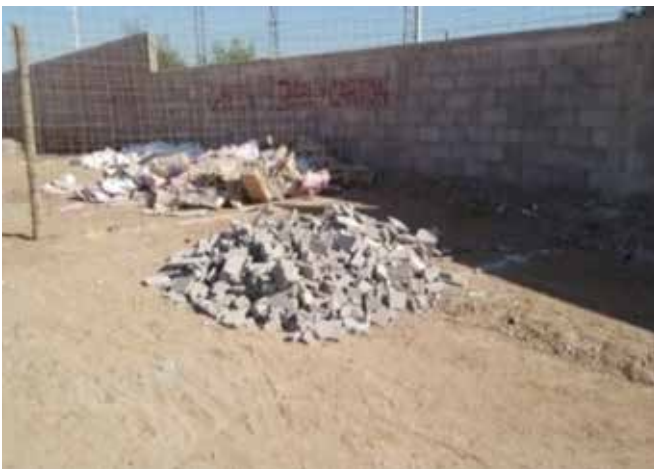
Figura 4. Recolección de mortero.

B) Residuo de mortero: Material generado por la fabricación, transporte, colocación, desperdicio o demolición de elementos a base de mortero.