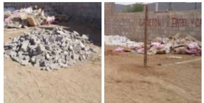
Figura 8. Áreas de disposición de residuos y/o desperdicios.

Los materiales recolectados se depositaron en áreas reservadas para cada tipo con el fin de llevar un control de ellos. La ubicación de los depósitos es en áreas cercanas al frente de obra para evitar que estos sean dispuestos en lugares diferentes (Figura 7).