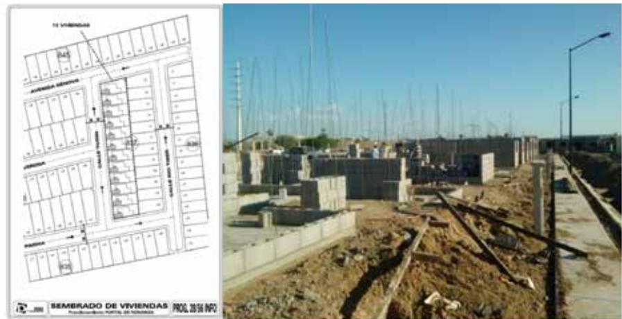
Figura 2. Localización del área de estudio dentro del fraccionamiento.

Se seleccionaron las casas de las que se midieron los materiales de desperdicio y residuos. Las casas seleccionadas se ubican en la manzana 837 del lote 14 al 25, siendo un total de 12 viviendas de 46.108 m 2 de construcción cada una.