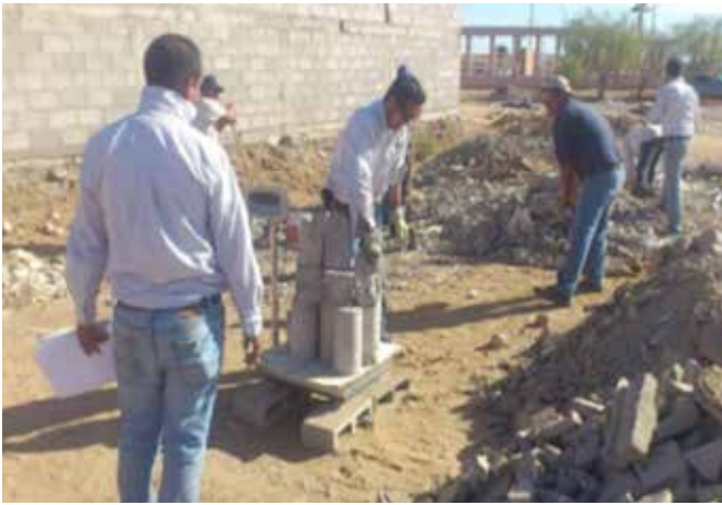
Figura 3. Concretos.

B) Residuo de mortero: Material generado por la fabricación, transporte, colocación, desperdicio o demolición de elementos a base de mortero.