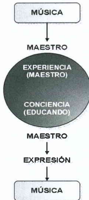
Fig.2 LA SÍNTESIS