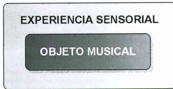
Fig.1 RESPUESTA MOTRIZ.

Etapa donde el objeto musical es percibido globalmente determinando una experiencia de marcado carácter sensorial. Ver Fig.1