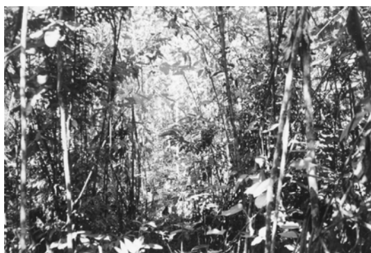
Figura 2. Trocha principal abierta para luego seleccionar la ubicación de las parcelas de evaluación dentro del Bosque Secundario de 8 años ubicado dentro del BNAVH.

Dentro de los 3 tipos de bosque seleccionados (Tabla 1), se establecieron parcelas de medición de 10 x 10 m 2 , es decir de 100m 2 o 0.01ha. El tamaño, número y ubicación de cada parcela siguió la Metodología para el Estudio de la Vegetación, propuesta por Matteucci et al. 1982. Una vez establecida, cada parcela fue limpiada, señalizadas, marcadas y evaluadas. Cada tipo de bosque seleccionado, contó con un número determinado de parcelas de evaluación (repeticiones). (Tabla 1)