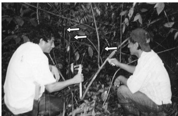
Figura 4. Medición de densidad y diámetro de la regeneración natural de Uncaria guianensis (Aubl.) J.F. Gmel.

Para poder manejar luego estas observaciones de manera cuantitativa se diseñó un sistema de valoración de vigor para cada parte observada en los individuos evaluados en el cual se ordena la información por presencia o ausencia de ramas viejas, ramas jóvenes o el estado fitosanitario de las hojas de cada uno de los individuos de U. guianensis que fueran hallados en cada parcela trabajada. (Tablas 3, 4 y 5).