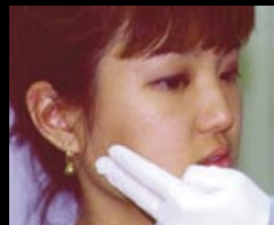
Figura 7. Palpación del músculo masetero superficial.