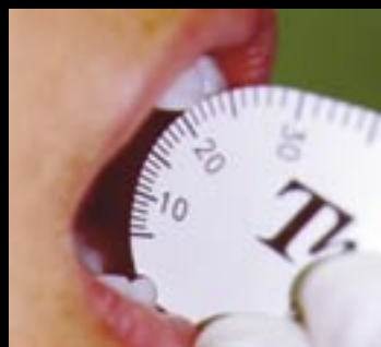
Figura 6. Medición interincisal en apertura.