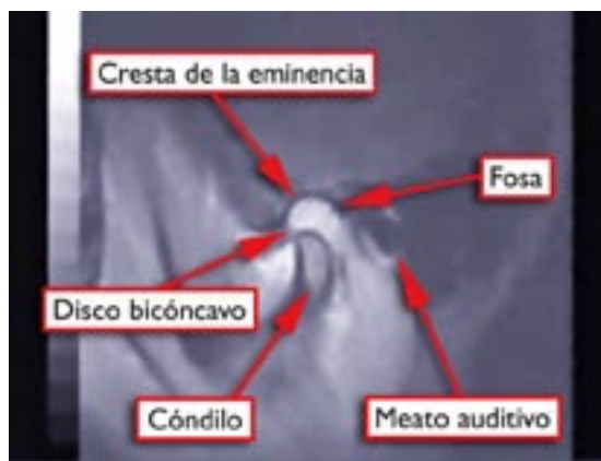
Figura 2. Vista sagital de un desplazamiento anterior de disco sin reducción en una imagen de resonancia magnética nuclear (IRM).

La inflamación articular puede resultar de una inflamación de la sinovial (sinovitis) y/o la cápsula articular (capsulitis), de un trauma, de infección o degeneración del cartílago, o como secuela de una poliartritis sistémica o enfermedad de la colágena (artritis reumatoide, lupus, síndrome de Reiters). La osteoartritis es una condición degenerativa articular no inflamatoria caracterizada por el deterioro y abrasión del tejido articular y