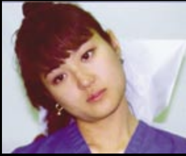
Figura 8. El movimiento cervical lateral debe tener una inclinación de 45 grados y estar libre de dolor.