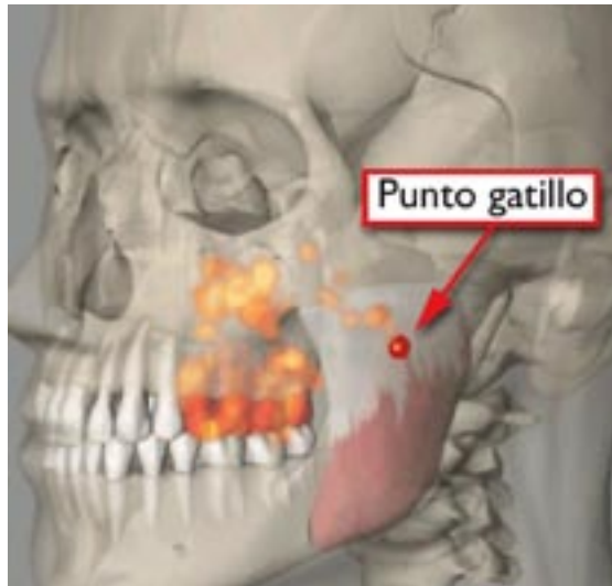
Figura 1. Sitios dolorosos localizados o puntos gatillo en el músculo, tendón o fascia con referencia a un sitio distante, como los dientes.