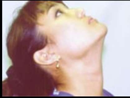
Figura 9. El movimiento de extensión cervical debe ser de casi 70 grados y estar libre de dolor.