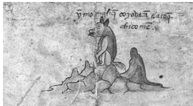
Figura 5. Zona A tercer plano.

En la representación, tanto del Tlalchiach como de los otros personajes indígenas de este códice, se observa la influencia occidental en trazos y proporciones, pero se nota cierta tendencia a pintar un poco más grande la cabeza con relación al cuerpo como en la gráfica prehispánica. El sacerdote se pintó de pie, con el cuerpo visto de tres cuartos con cabeza y rostro de perfil; lleva el pelo erizado por el dolor y el espanto del ataque recibido. Igual que los otros señores indígenas que esperan, aterrados, su turno a ser ejecutados, el Tlalchiach porta el quetzal-tlalpiloni , el enorme adorno de la cabeza para atar los cabellos con dos borlas pintadas con pigmento dorado (exclusividad cromática en el tocado de este personaje), y un manojo de plumas verdes de quetzal que sólo usaban los señores de mayor jerarquía. Este relevante personaje al centro de la pictografía es representado con el mayor tamaño de todo el conjunto y lleva las manos atadas al frente, las cuales sólo hacen visible parte del taparrabos que portaba.