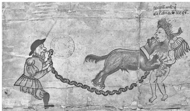
Figura 4. Zona A segundo plano.

El segundo plano de la Zona A es a la vez la escena central del códice, la cual inicia con un personaje español anónimo en funciones de verdugo, quien se pintó visto de perfil derecho.