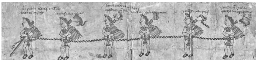
Figura 6. Zona B.

men , cuya traducción es: fueron siete los tlatoque que fallecieron en Coyohuacan”. 20