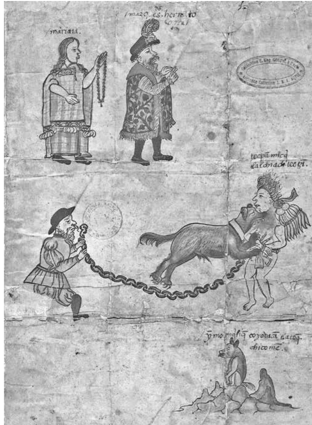
Figura 2. Zona A.

no impide, la lectura de los conjuntos de personajes, de glifos y del registro alfabético. El espacio de la lámina se organizó en cuatro planos horizontales y uno vertical, donde se distribuyeron las imágenes y las glosas breves que completan la narración gráfica; pero con el fin de codificarlos y describirlos se han marcado tres zonas: Zona A, que comprende los tres primeros planos horizontales; la siguiente Zona B consiste en el único plano vertical que va de uno a otro lado, a lo largo del margen derecho de la lámina; y la última Zona C contiene el cuarto y último plano horizontal.