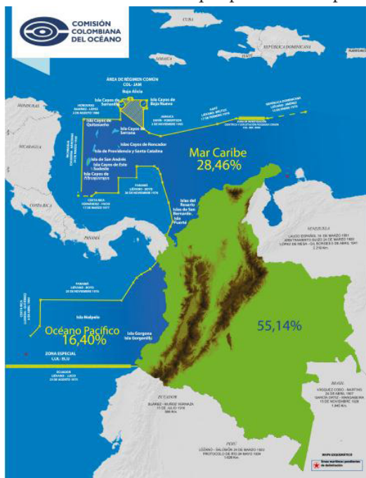
Figura 1. Extensión Marítima de Colombia.

Es evidente que el territorio nacional posee una gran riqueza representada en variedad de recursos que pueden ser aprovechados de manera sustentable, con el fin de incidir directamente en la población y, por tanto, en el desarrollo socioeconómico del país. Asimismo, este amplio territorio tiene un potencial de energías alternativas, y es fuente de descubrimientos insospechados en su profundidad tanto en el Caribe como en el Pacífico (Universidad de Antioquia, 2019).