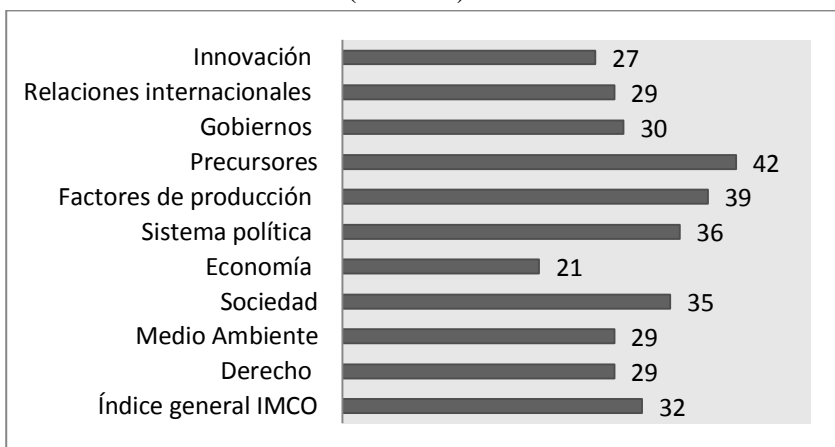
Gráfica 2. México: índice de competitividad IMCO, 2013 (Posición)