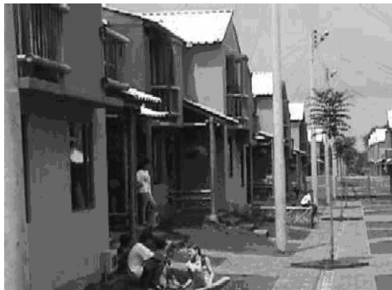
Foto 3.- Casa Habitación Económica ya terminada, este modelo es mas parecido a las construcciones hechas en México 1 .

clases duraderas de cañas de bambú puedan durar un tiempo mayor, hincadas en el suelo, mediante la aplicación del pentaclorofenol en una forma apropiada. Mientras se estudian tratamientos convenientes y económicos para la preservación del bambú en condiciones en que se humedezca frecuentemente o que este en contacto con la tierra húmeda, se considera conveniente emplear para los cimientos algún material que sea mejor que el bambú no tratado, por ejemplo el concreto, la piedra, el tabicón de concreto. Si se emplea el bambú como soporte en casas de bajo costo, las cañas deberán tener un diámetro mayor, paredes gruesas y nudos más próximos, para proporcionar un máximo de resistencia al pandeo. Cuando no se puede obtener piezas grandes de bambú es conveniente emplear pequeños bambúes, con características estructurales adecuadas, amarrados y formando pilares compuestos.