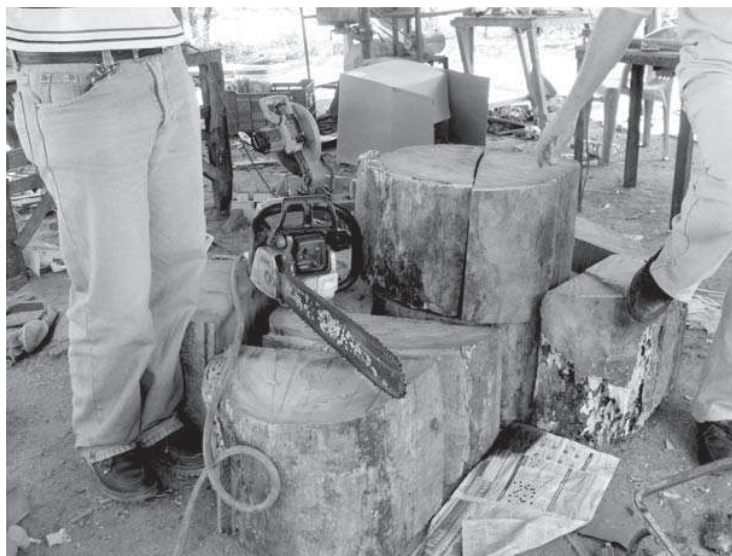
Figura 1 Detalles de un taller de artesanía de madera, estado Lara

Hidalgo (1999) sobre las especies arbóreas, se hicieron varios reconocimientos sobre la insostenibilidad del modo de producción de las tallas. Entre las situaciones resaltadas por los artesanos, se señalaron: la creciente dificultad para obtener las materias primas, así como la ilegalidad de su utilización, e incluso la utilización de madera fresca (verde) lo cual afecta la calidad de las obras. Lo importante fue, que en el proceso de reflexión colectiva se hicieron planteamientos como la necesidad de sembrar, la incompatibilidad de las siembras con la explotación caprina extensiva, la posibilidad de sustituir las especies utilizadas por algunas maderas comerciales (de aserradero), entre otras. En la Figura 1, se observa un taller con muestras de explotación de materias primas locales.