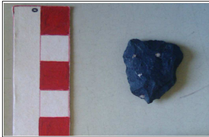
Figura 2. Artefacto compuesto, raspador/ burilante formatizado sobre artefacto retomado (base de punta de proyectil que recuerda a algunas puntas de la transición).

En lo referente a los FNRC (n=9) y litos modificados por uso (n= 4), en nuestro caso son artefactos de andesita (n= 5) y metacuarcita (n= 5), de sílice (n= 2) y granito (n= 1). 6 de estos especímenes presentan reserva de corteza que va de 15 a 55%. No hay distinciones por materias primas.