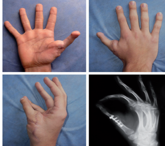
Figura 2. Trasplante dedo pie a mano, a los 8 meses de seguimiento se observa buen resultado. El paciente está satisfecho con el resultado.