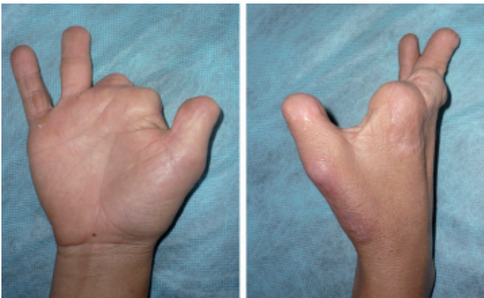
Figura 3. Paciente de sexo femenino de 33 años de edad, amputación parcial del pulgar y el cuarto dedo y amputación casi completa del segundo y tercer dedo. Anteriormente se realizó un alargamiento en el pulgar. Se realizó un segundo trasplante de de pie a mano.