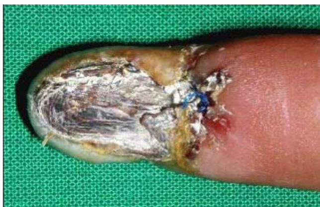
Figura 1. Necrosis del lecho ungueal con extensión hacia el epiniquio con edema y eritema del IV dedo de mano izquierda.