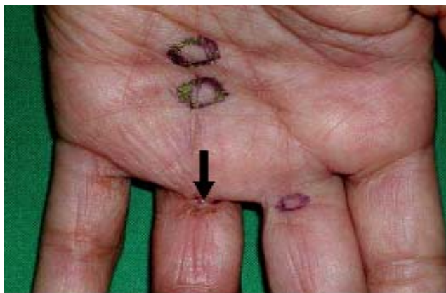
Figura 2. Nódulos subcutáneos palmares dolorosos y retracción en el pliegue metacarpo-falángico (flecha) del IV dedo de la mano izquierda.