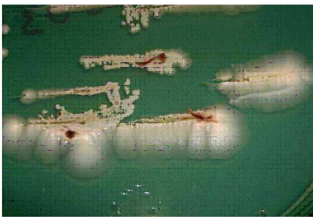
Figura 4. Cultivo en agar Sabouraud con colonias levaduriformes, algodonosas, cremosas.

físico se observa paciente en buen estado general, afebril, normotensa, con una lesión hiperpigmentada que compromete toda la unidad ungueal con destrucción de la placa y necrosis del lecho de la uña, que se extiende hacia el epiniquio, con una costra fuertemente adherida (Foto 1). Además, se aprecian en la superficie palmar, nódulos subcutáneos, dolorosos que siguen un trayecto lineal (Foto 2). Antecedentes negativos para diabetes, hipertensión e infecciones.