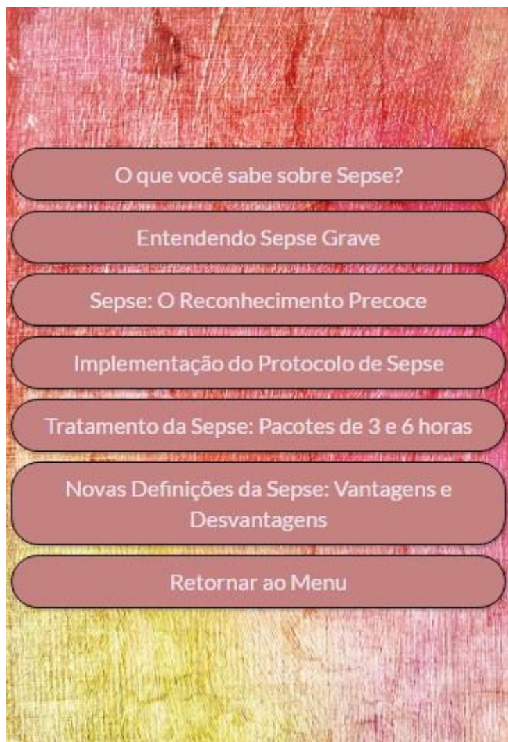
Figura 4 - Menu dos vídeos. Florianópolis, Santa Catarina, Brasil, 2017

Após os aprimoramentos, o aplicativo foi novamente disponibilizado para as seis enfermeiras, para que pudessem reavaliá-lo. Alguns destes relatos estão descritos abaixo: