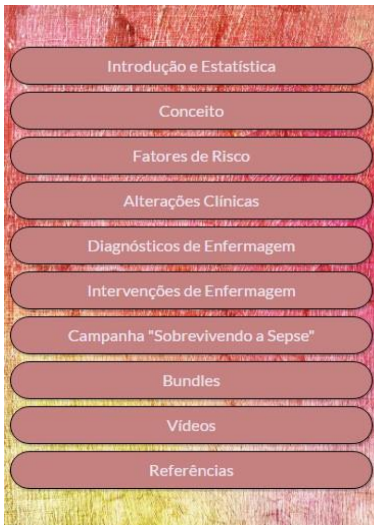
Figura 2 - Menu principal. Florianópolis, Santa Catarina, Brasil, 2017

A seguir, apresentam-se as duas categorias elaboradas: Avaliação do conteúdo do aplicativo e Aprimoramento do conteúdo do aplicativo.