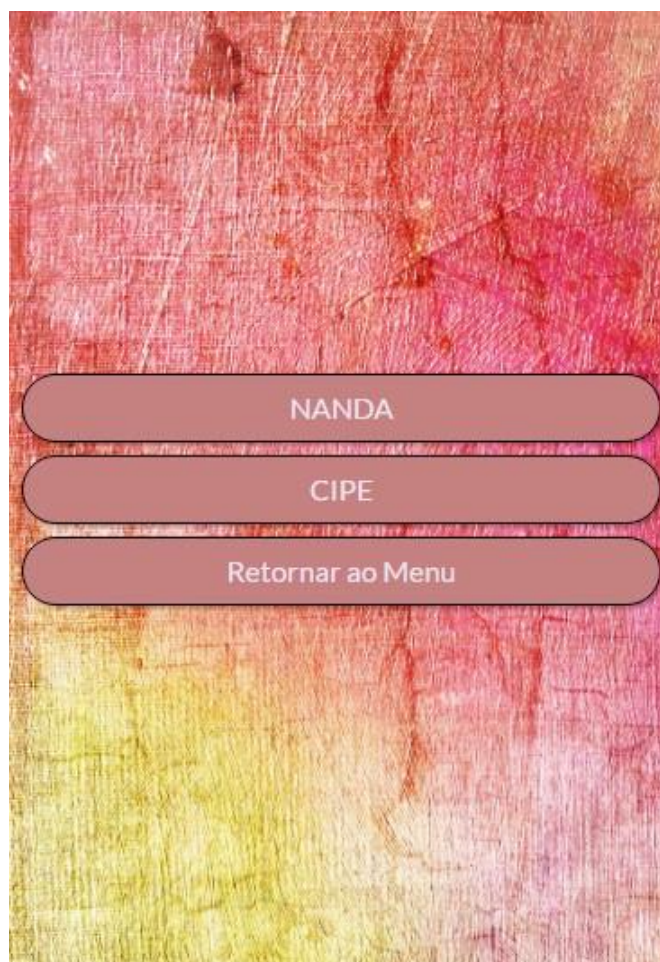
Figura 3 - Menu dos diagnósticos de enfermagem. Florianópolis, Santa Catarina, Brasil, 2017

Após a etapa de avaliação do aplicativo, foram realizadas algumas melhorias, destacando-se: Troca de alguns segmentos de texto por figuras, imagens e gráficos, facilitando a visualização e o entendimento rápido do conteúdo; Melhoramento no design do aplicativo; Inclusão dos diagnósticos de enfermagem CIPE® e NANDA® ( North American Nursing Diagnosis Association ) com menu, possibilitando a alternância entre eles, de modo que outros contextos de trabalho dos enfermeiros, inclusive em outras unidades hospitalares, pudessem fazer uso do aplicativo; Adição de menus secundários individuais (alterações clínicas, diagnósticos de enfermagem e vídeos), nos quais o usuário pode selecionar, dentro do menu de alterações clínicas, aquelas que lhe interessar naquele momento, ou, então, ao entrar no menu de vídeos, clicar naquele de interesse e o mesmo abrir em um programa específico de vídeos; Acesso aos artigos, periódicos e estudos usados no aplicativo no menu principal (Figura 3 e 4).