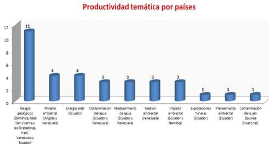
Figura 3. Productividad temática por países

El impacto ambiental es el término temático más representado, siendo la temática prevaleciente en el interés de los investigadores en los estudios realizados. En segundo lugar, la eficiencia energética y en tercero el ahorro de energía, ambos términos abordados de manera muy relacionada. Los recursos naturales más representados son los recursos mineros estudiados desde su explotación e impacto ambiental, a estos le siguen las aguas subterráneas y el suelo. El área docente con mayor aporte de investigaciones es la geología, dado en lo fundamental por el evidente vínculo de esta ciencia con el medio ambiente.