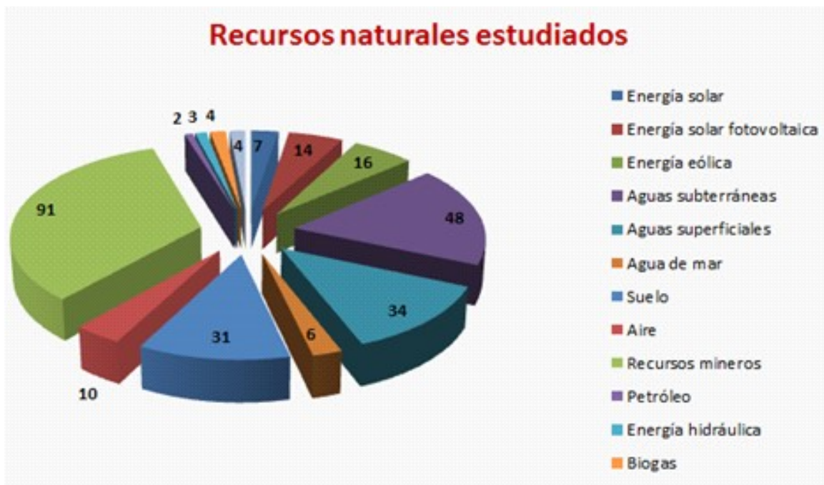
Figura 2. Recursos naturales estudiados

Variable 3. Áreas geográficas enmarcadas en las investigaciones.